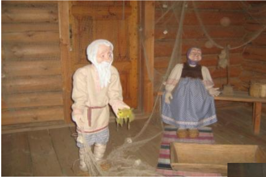
«О рыбаке и рыбке»