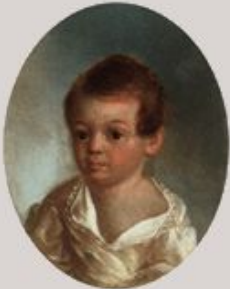
К. Де-Местр. Пушкин-ребенок (1801-1802)