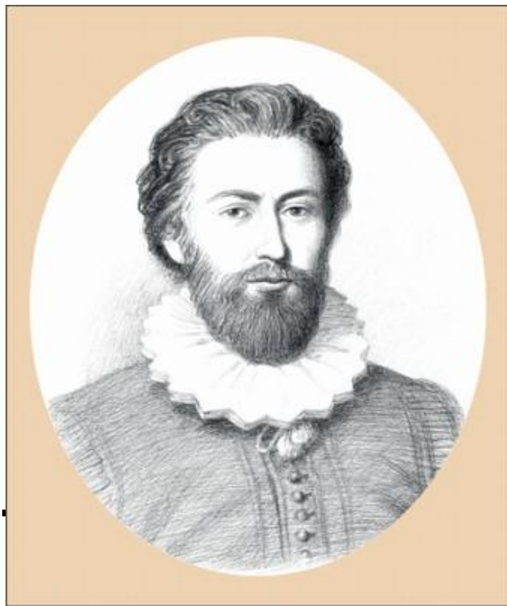
Франсуа ВИЕТ (1540–1603)