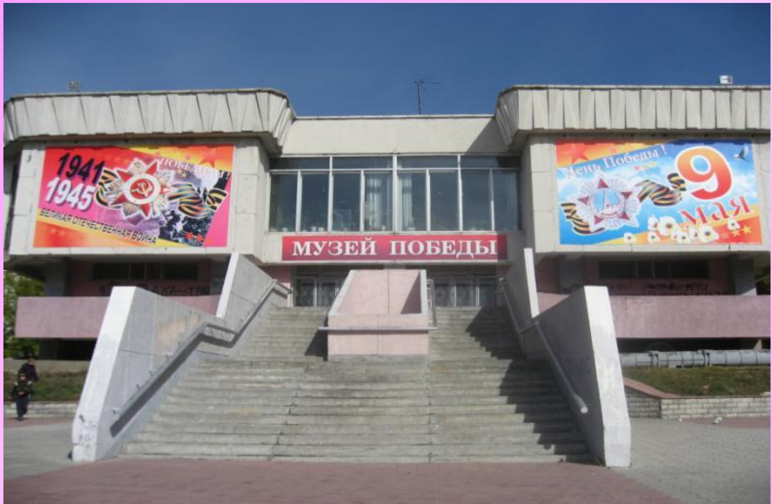
Музей Победы г. Ангарск.