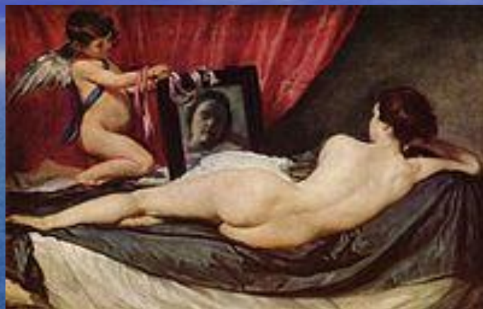
« Венера с зеркалом », ок. 1644—1648