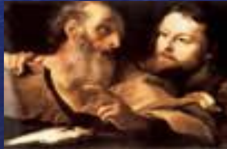
Святой Андрей и Святой Томас