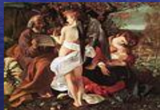
Отдых на пути в Египет . 1596—1597.