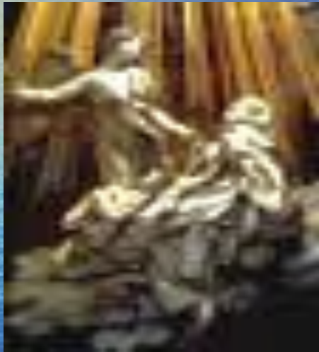
Экстаз святой Терезы