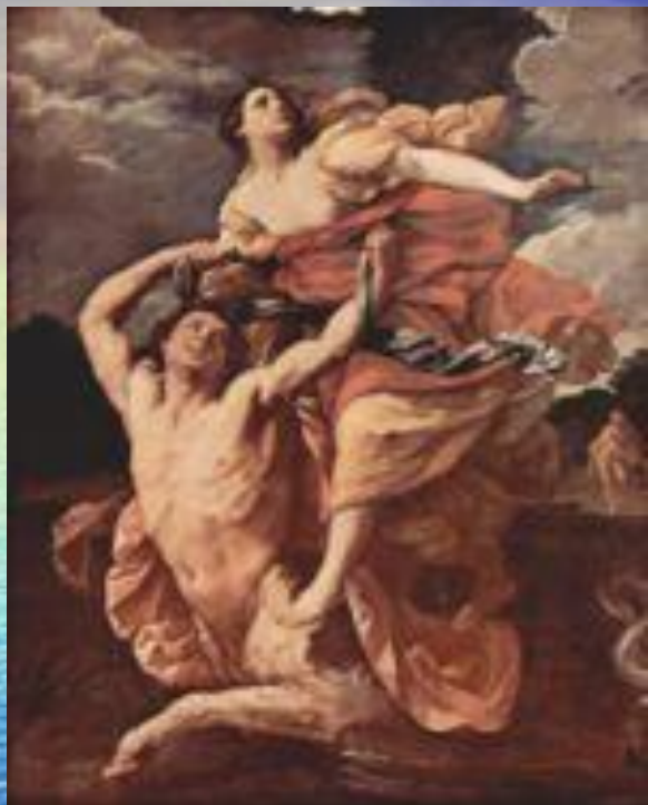
Похищение Деяниры, Лувр