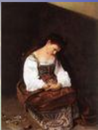
Кающаяся Мария Магдалина