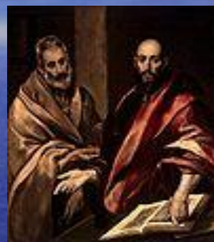
Апостолы Пётр Апостолы Пётр и Павел .