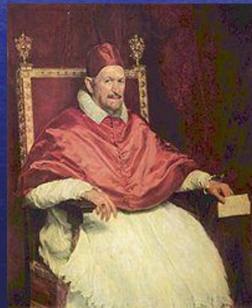
« Портрет папы Иннокентия X », 1650