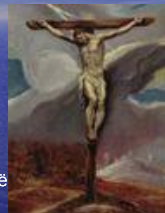
Христос на кресте