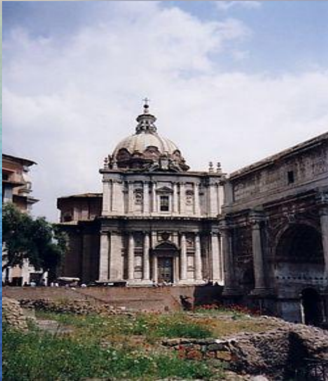
Пьетро да Кортоне Церковь Святого Луки и Святой Мартины, Рим

Кортоне ) (1 ноября 1596, Кортоне, Ареццо ) (1 ноября 1596, Кортоне, Ареццо — 16 мая 1669 ) (1 ноября 1596, Кортоне, Ареццо — 16 мая 1669, Рим ) (1 ноября 1596, Кортоне, Ареццо — 16 мая 1669, Рим) — итальянский ) (1 ноября 1596, Кортоне, Ареццо — 16 мая 1669, Рим) — итальянский живописец и архитектор .