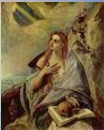
Кающаяся Мария Магдалина