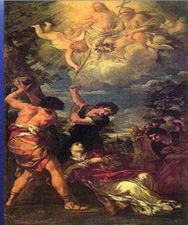
Побиение Святого Стефана камнями. 1660