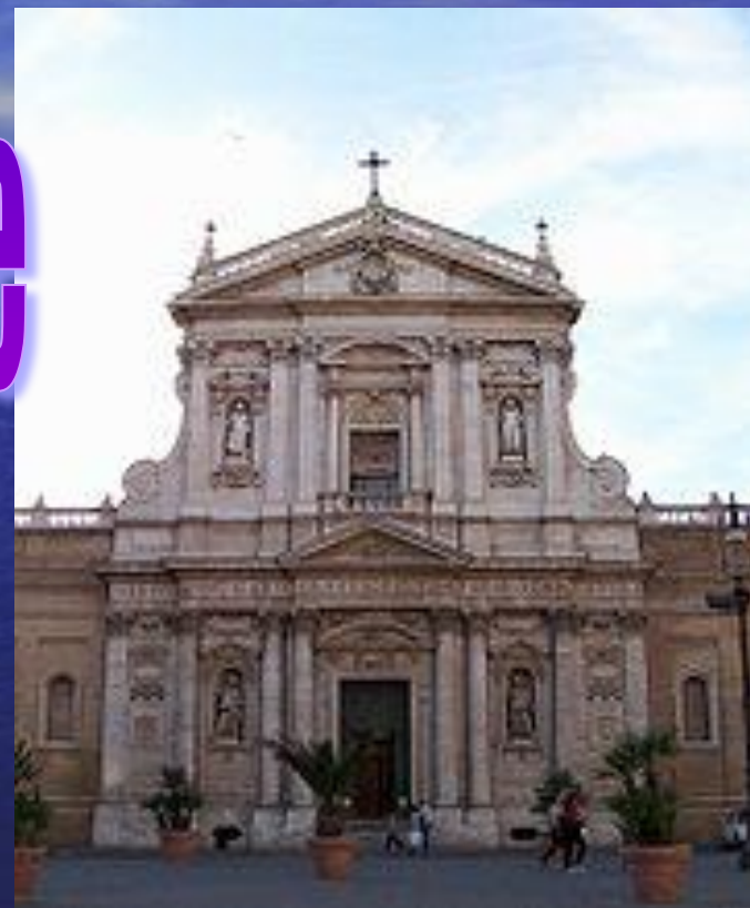
Карло Мадерна Церковь Святой Сусанны , Рим