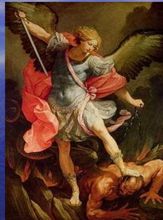
Архангел Михаил Архангел Михаил. Около 1636. Рим, церковь Санта-Мария-делла- Кончещионе