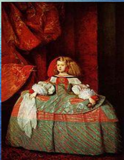
Инфанта Маргарита Австрийская, 1660