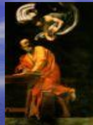
Св. Матфей и ангел