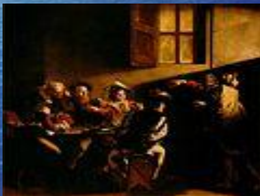
Призвание апостола Матфея