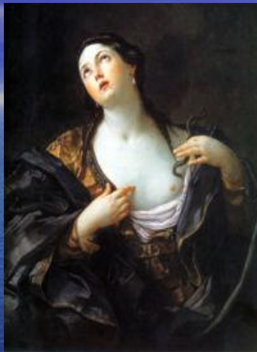
Смерть Клеопатры . Около 1595-1598