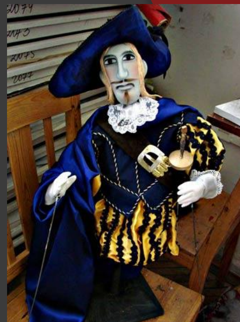
3. Тростевая кукла