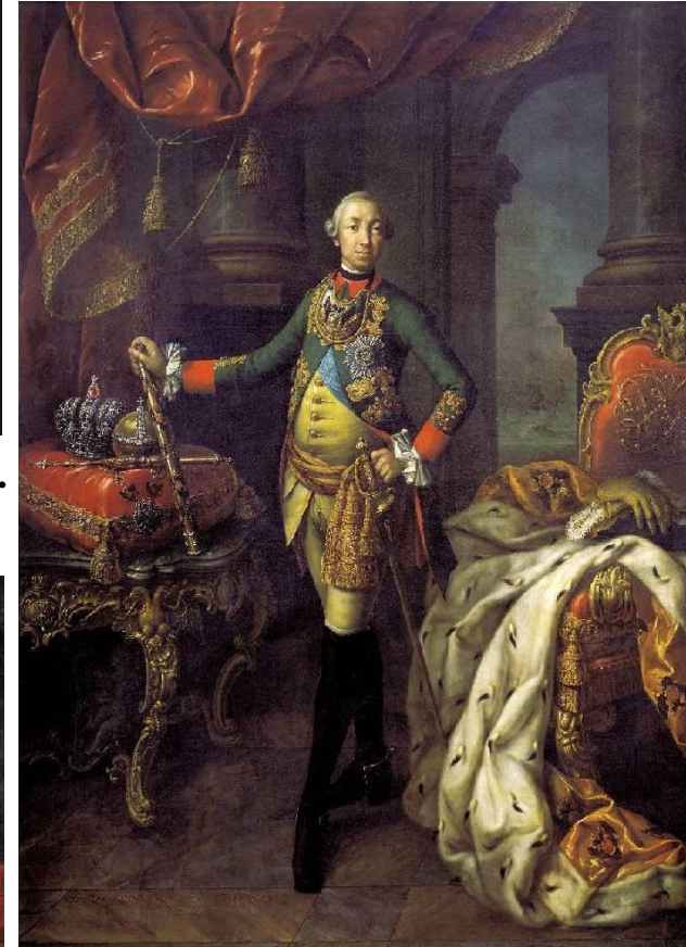
Портрет Петра III