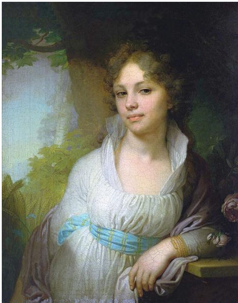
Портрет М. И. Лопухиной