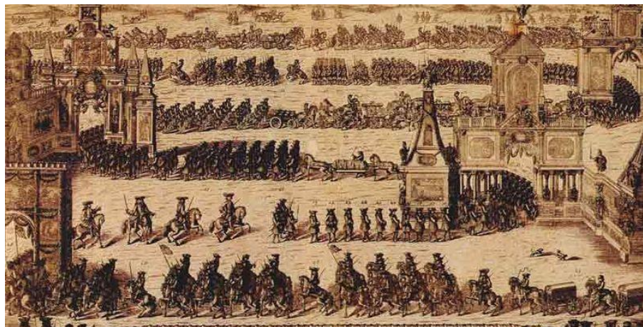
Торжественное вступление русских войск в Москву после Полтавской победы 21 декабря 1709 г