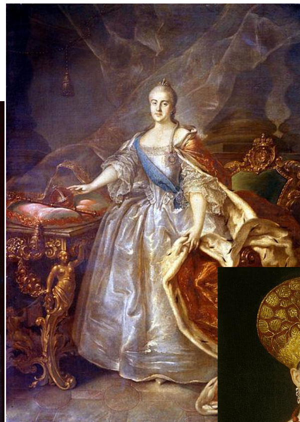
Портрет Екатерины II