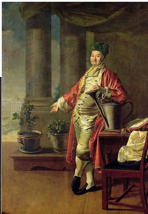
Портрет П. А. Демидова