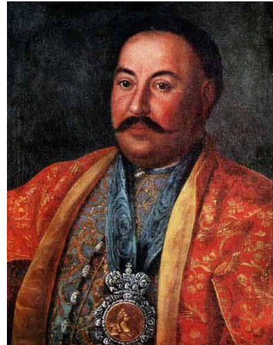
Портрет атамана Краснощёкова