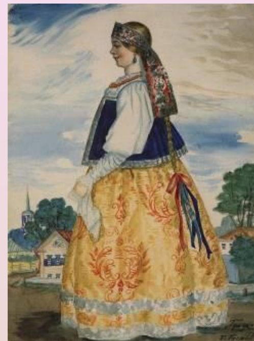
Кустодиев Б.М. Купчихи