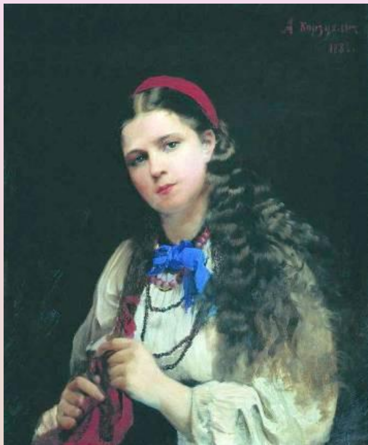
Корзухин А.И. Девушка, заплетающая косу