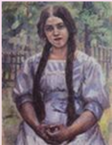
Суриков В. Девушка с косами