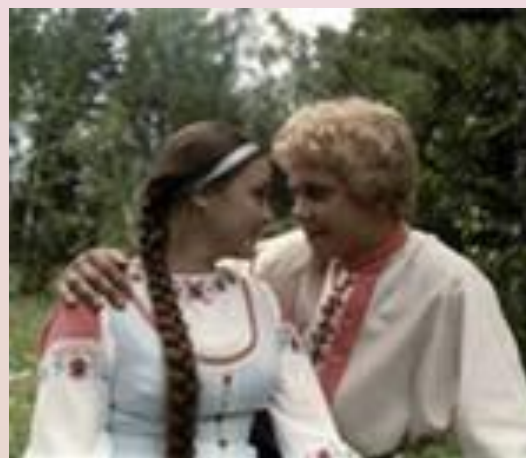
Варвара краса-длинная коса