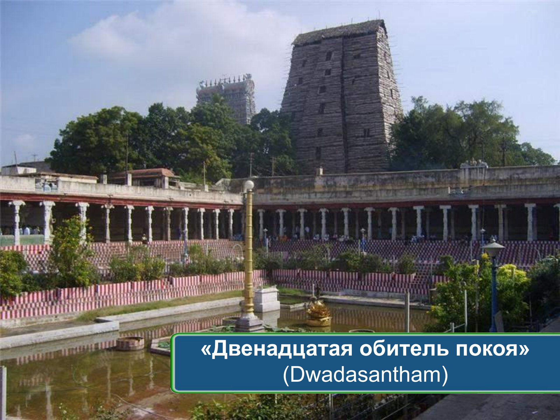
«Двенадцатая обитель покоя» (Dwadasantham)