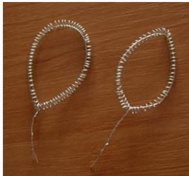
(Слева лепесток цветка, справа - листик)