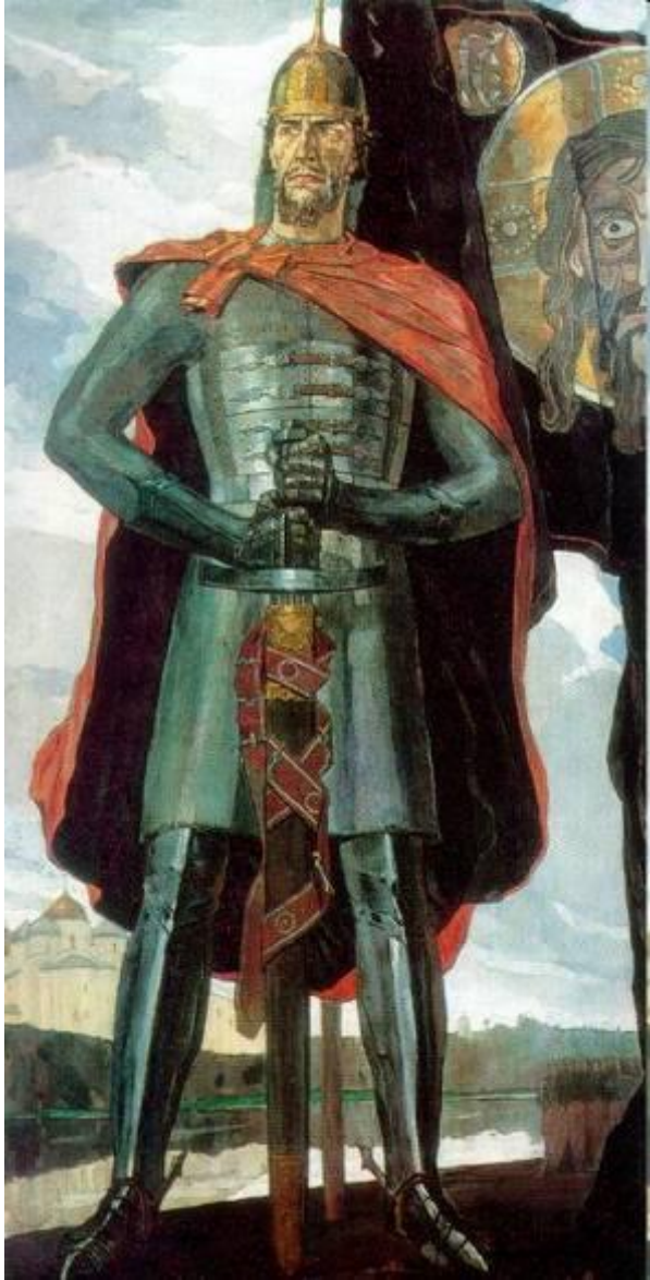
П. Корин Александр Невский