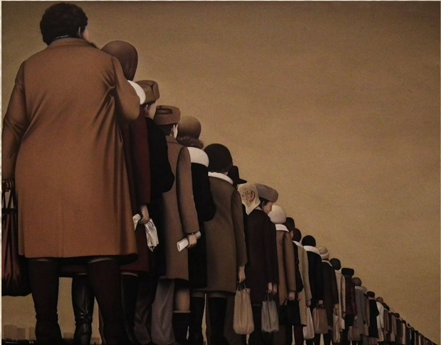
А. Сундуков, Очередь, 1986