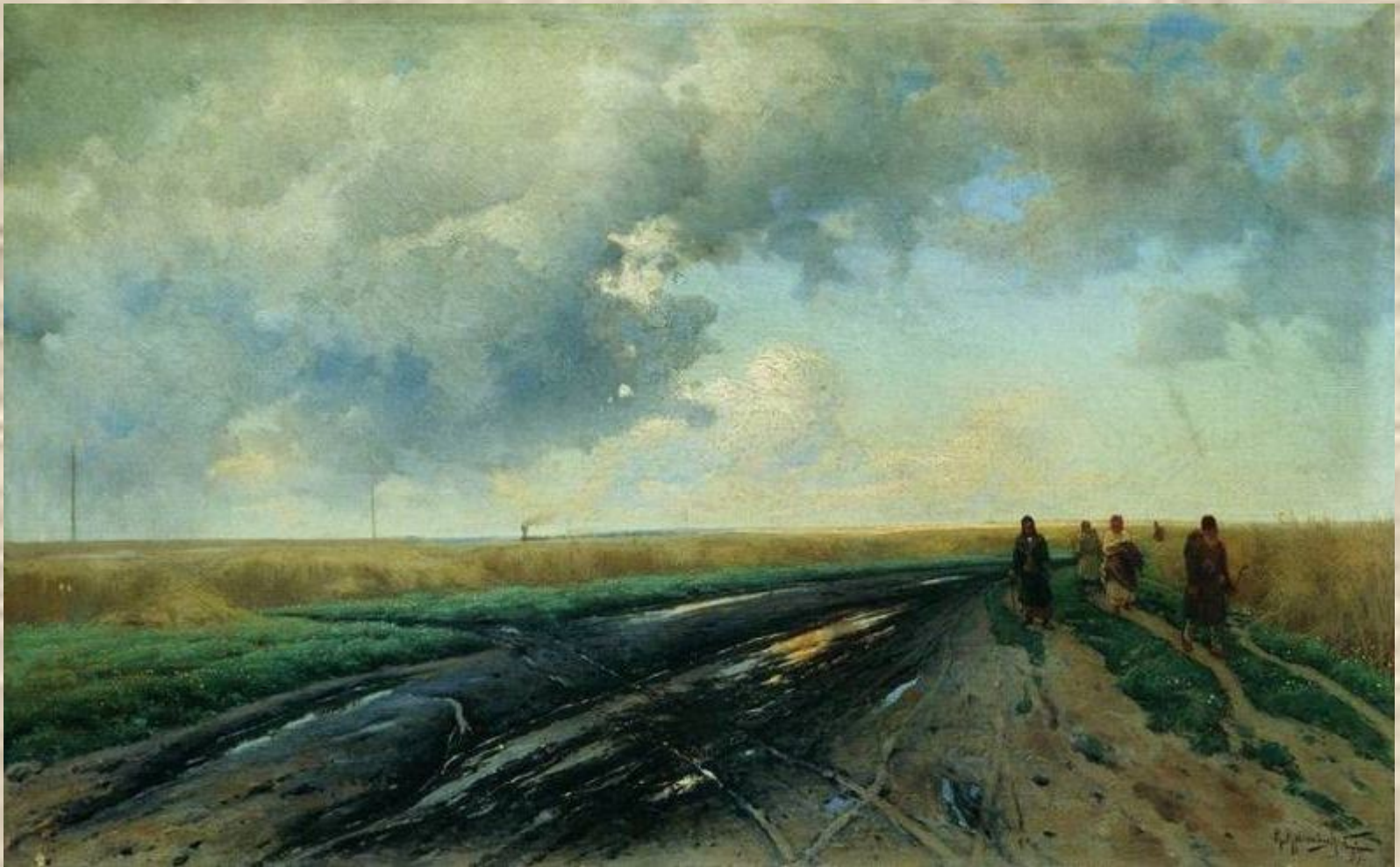
К. Крыжицкий. Дорога после дождя.