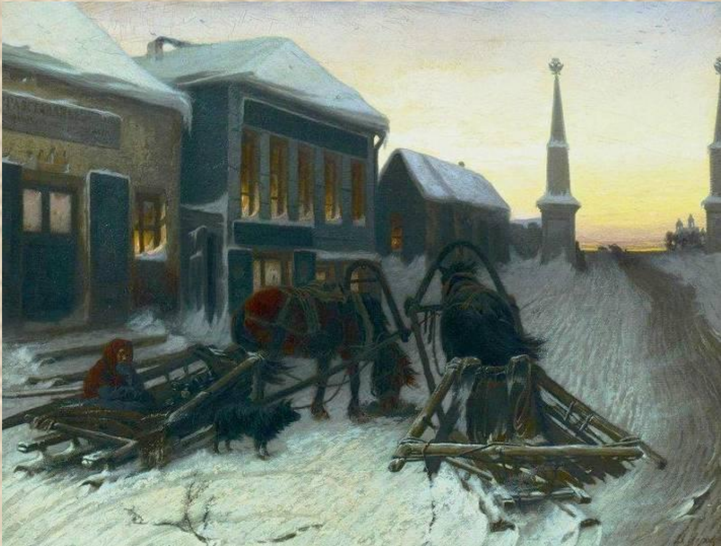
В. Перов. Последний кабак у заставы.