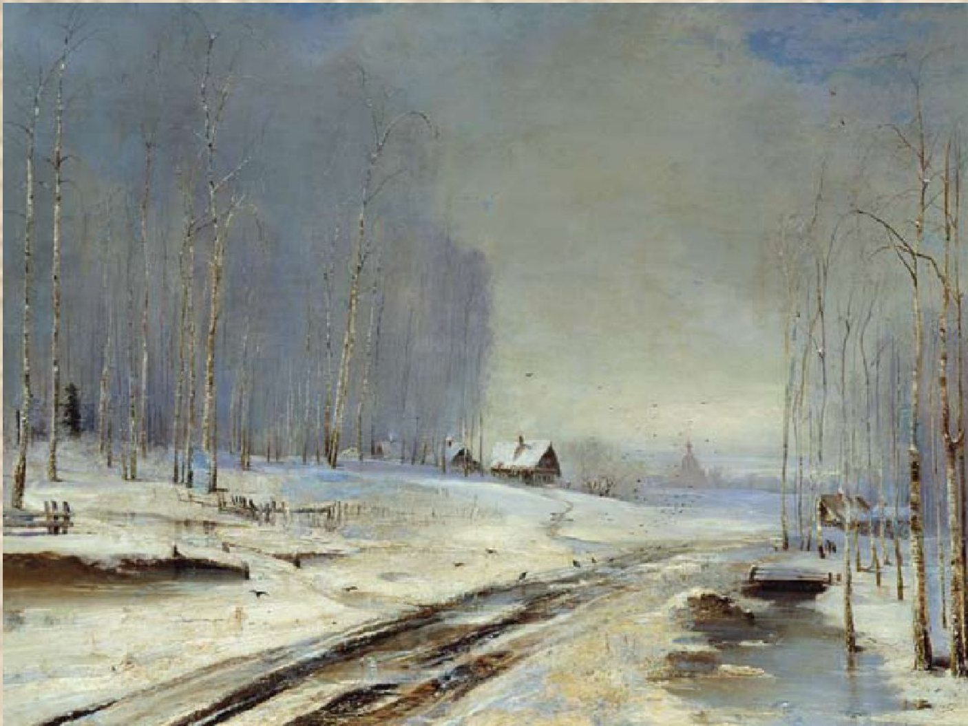
А. Саврасов. Распутица.