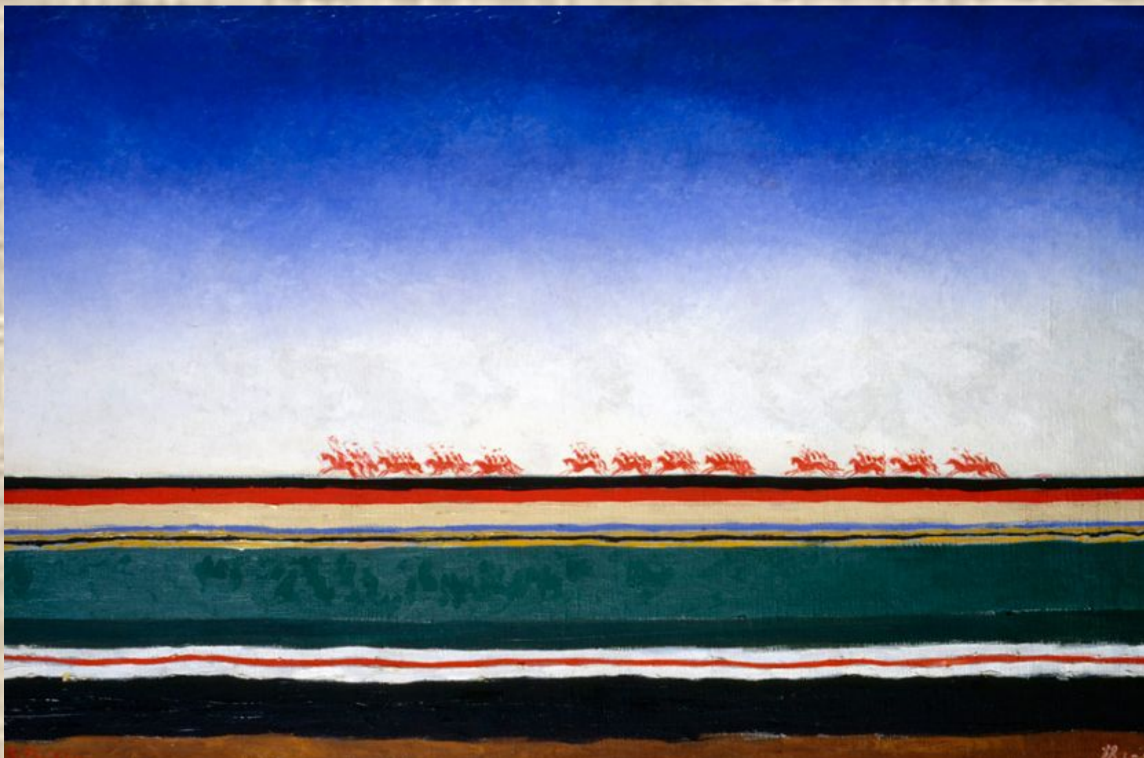
К. Малевич. Красная конница