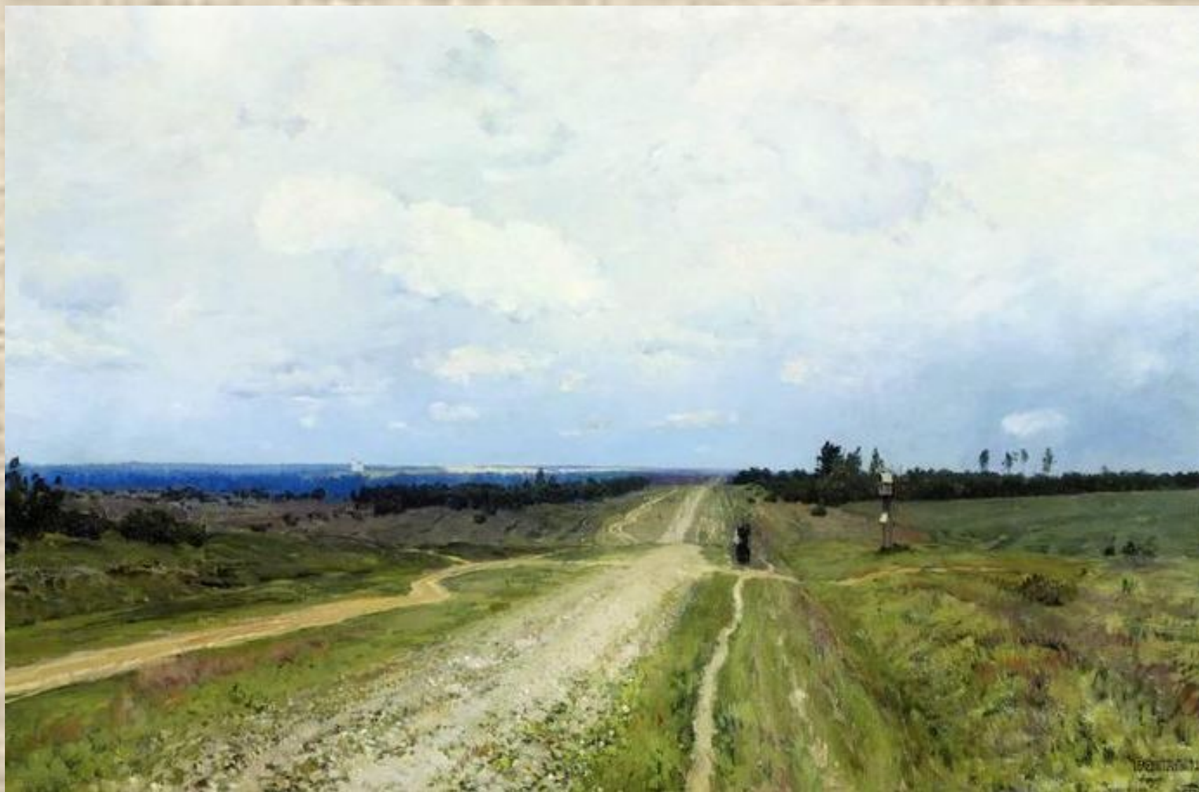
И Левитан. Владимирка, 1892