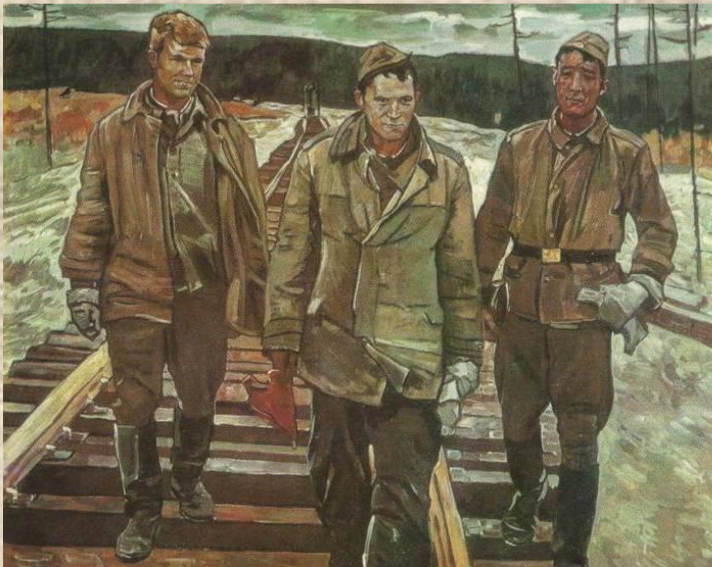
М.И.Самсонов. Утро БАМа.