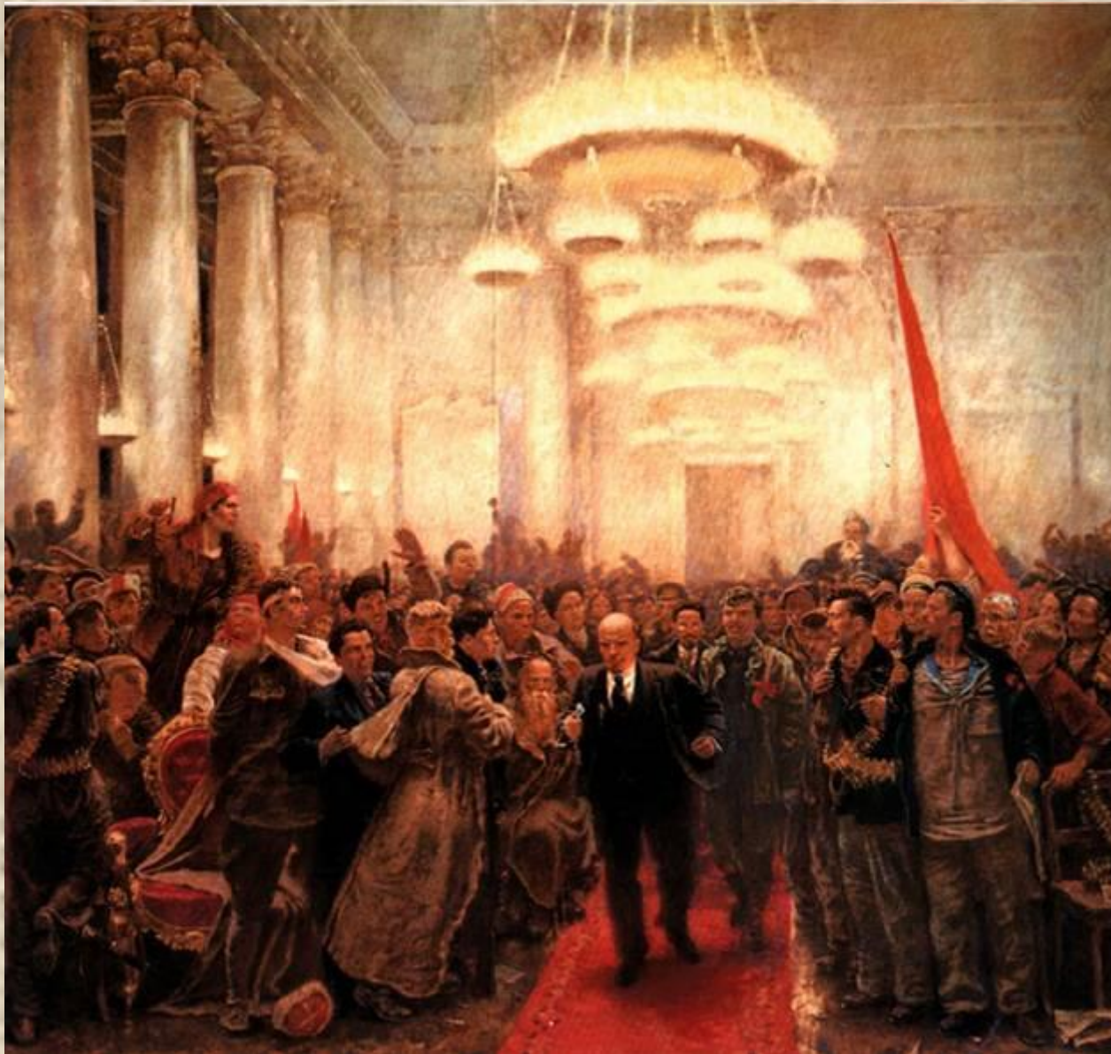
А. Самохвалов. Появление В.И. Ленина на II Всероссийском съезде Советов