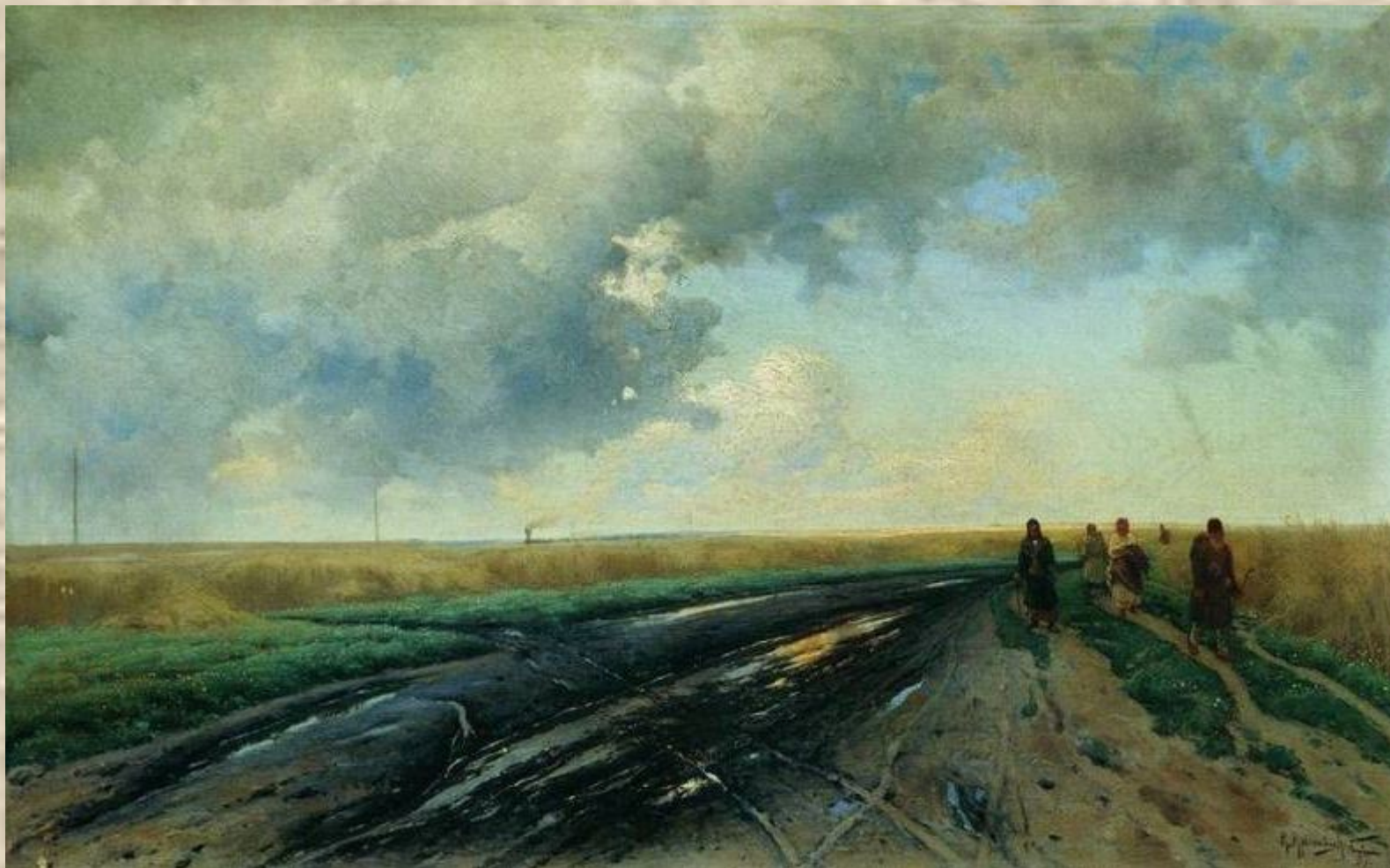
К. Крыжицкий. Дорога после дождя.