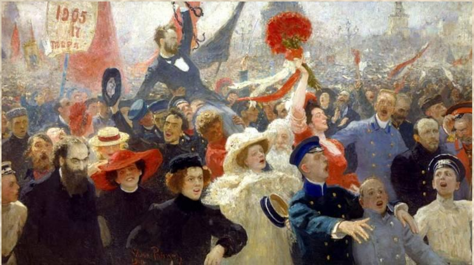
И.Репин. «17 октября 1905 года»