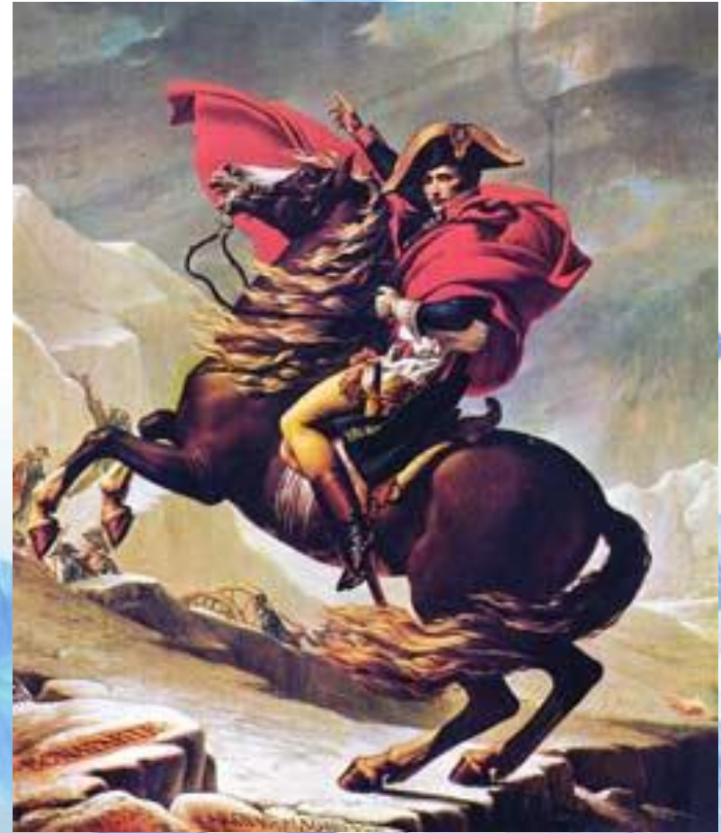
Переход Наполеона через Альпы. 1800.