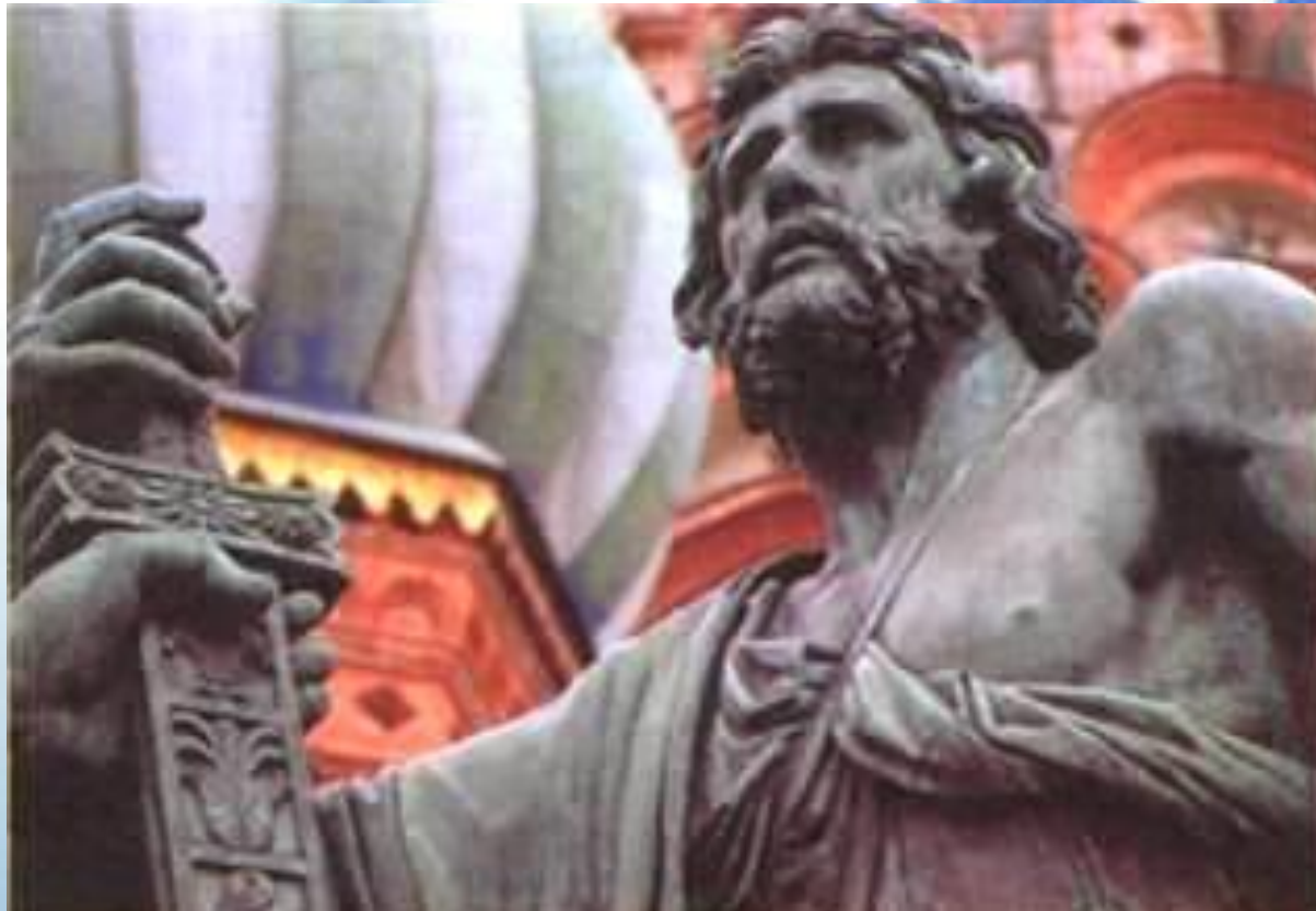
Иван Мартос. Памятник Минину и Пожарскому (фрагмент)