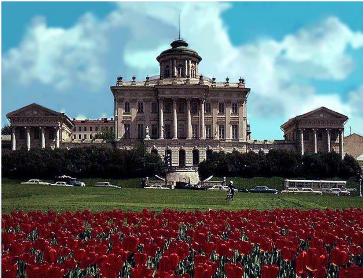
Дом Пашкова В.И.Баженов, 1784-1786 Россия, Москва