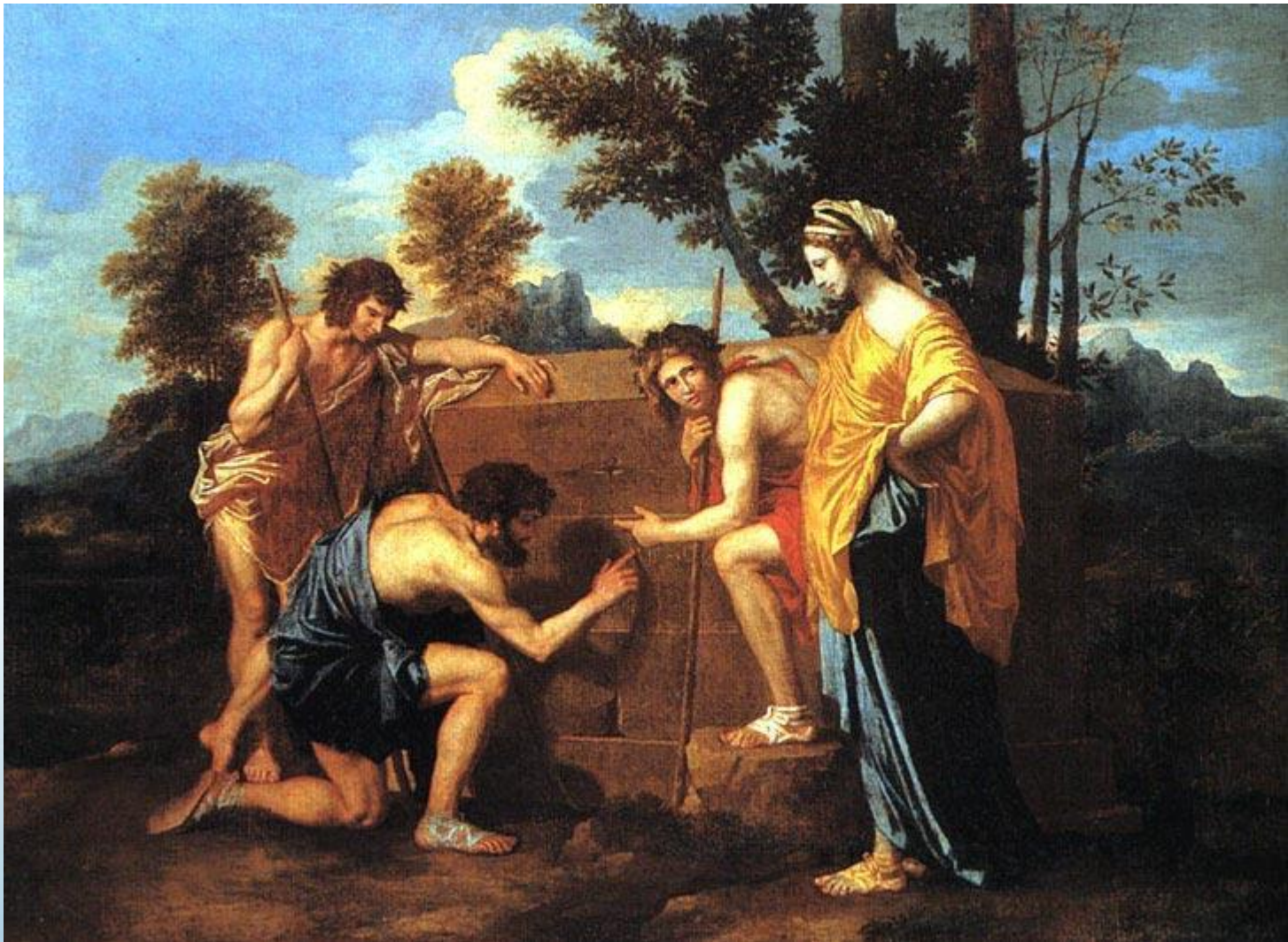
Пастухи в Аркадии 1638-1640