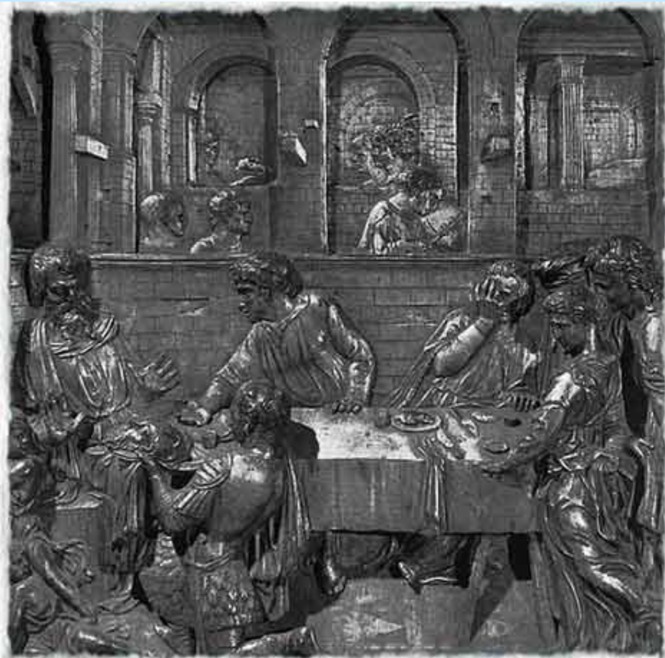
1427. Голову Предтечи приносят Ироду. Донателло. Бронза, высота 60 см. Сиена, баптистерий церкви св. Иоанна.