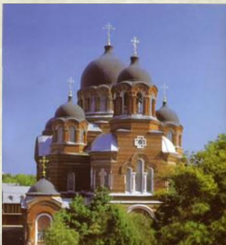
1. Свято-Екатерининский (кафедральный) собор