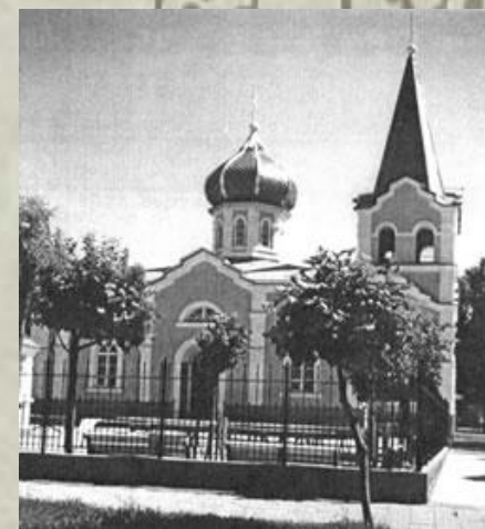
6. Свято- Онуфриевский храм.