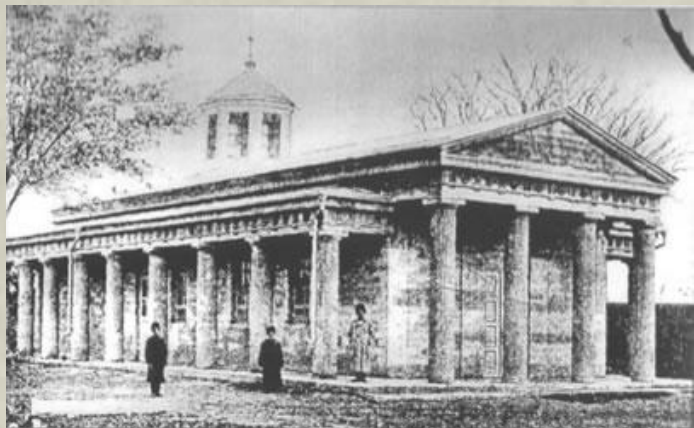
2. Покровская церковь в Тамани