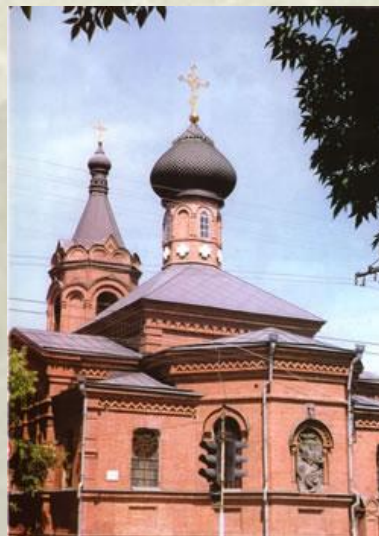
4. Церковь Святого пророка Или