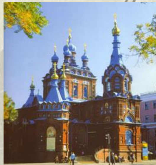
5. Церковь в честь Георгия Победоносца