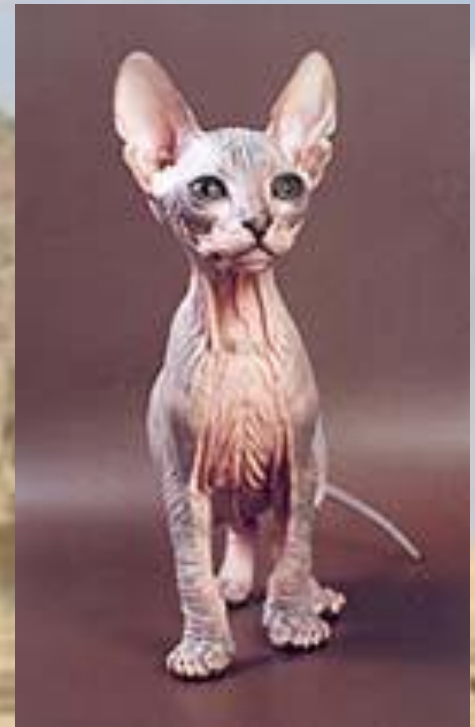
донской сфинкс (или донской лысак)