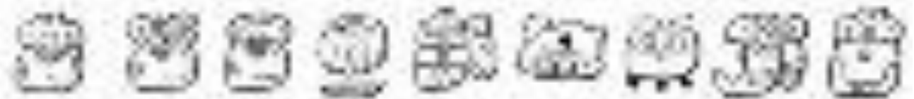
Культура цивилизации майя. Иероглифы азтекской 16-миллион.

https://www.researchgate.net/publication/339999999