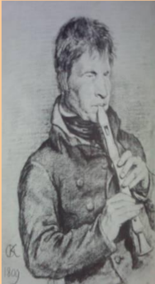
О.Кипренский. Портрет музыканта.