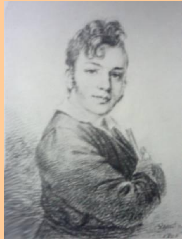
А.Венецианов. Портрет М.П.Родзянко.