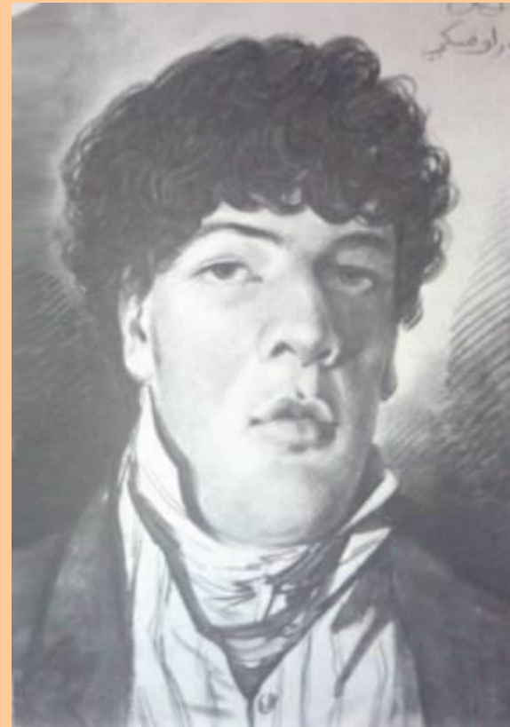
А. Орловский. Портрет Л. Дюпора.