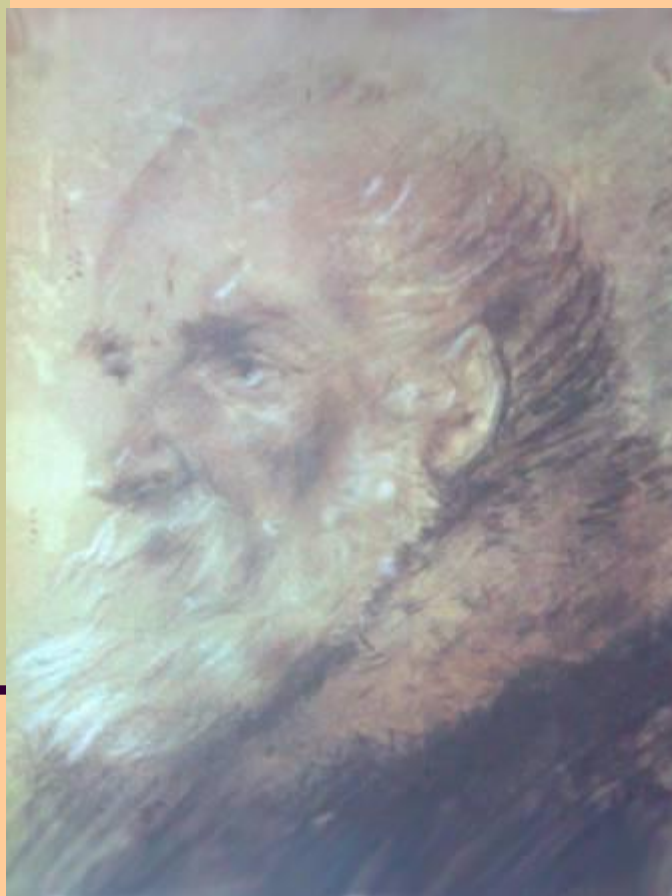
А.Орловский. Портрет старика