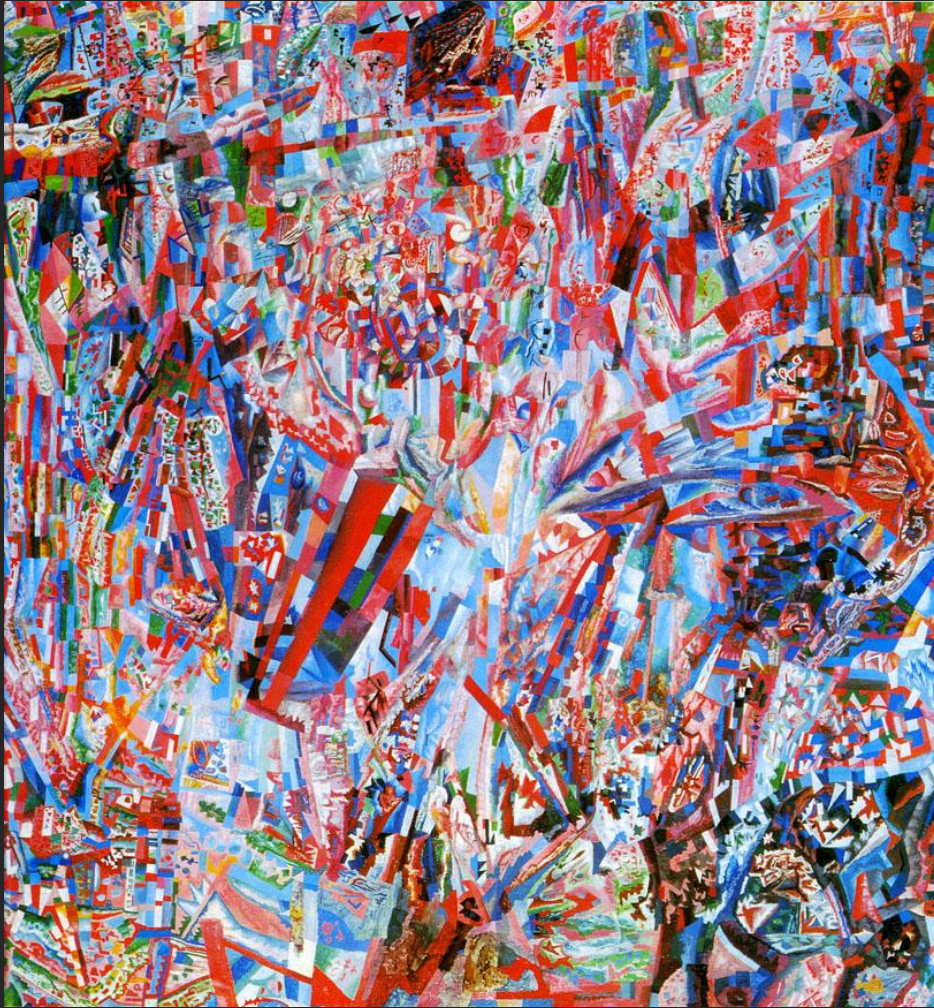
П. Филонов. Формула весны. Начало 1920-х

Не видя подлинника, трудно почувствовать нервность живописной ткани картины П. Филонова, волшебную игру света на полотнах К. Моне, магию «игры» со зрителем Р. Магритта.