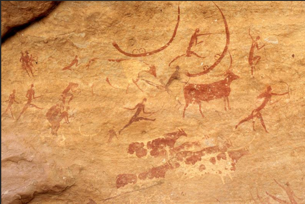
Фреска Тассилин-Аджер. 25 500 г. до н. э.

Интернет-пространство дает возможность безграничного виртуального путешествия по миру.