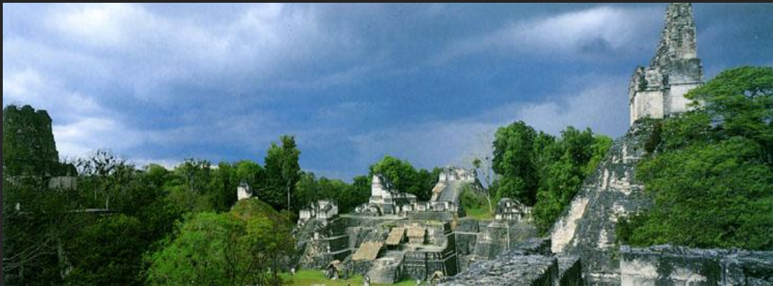
Город майя Тикаль. IV–X вв.

Интернет-пространство дает возможность безграничного виртуального путешествия по миру.