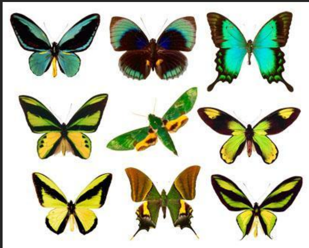
Коллекция бабочек (s33.radikal.ru)