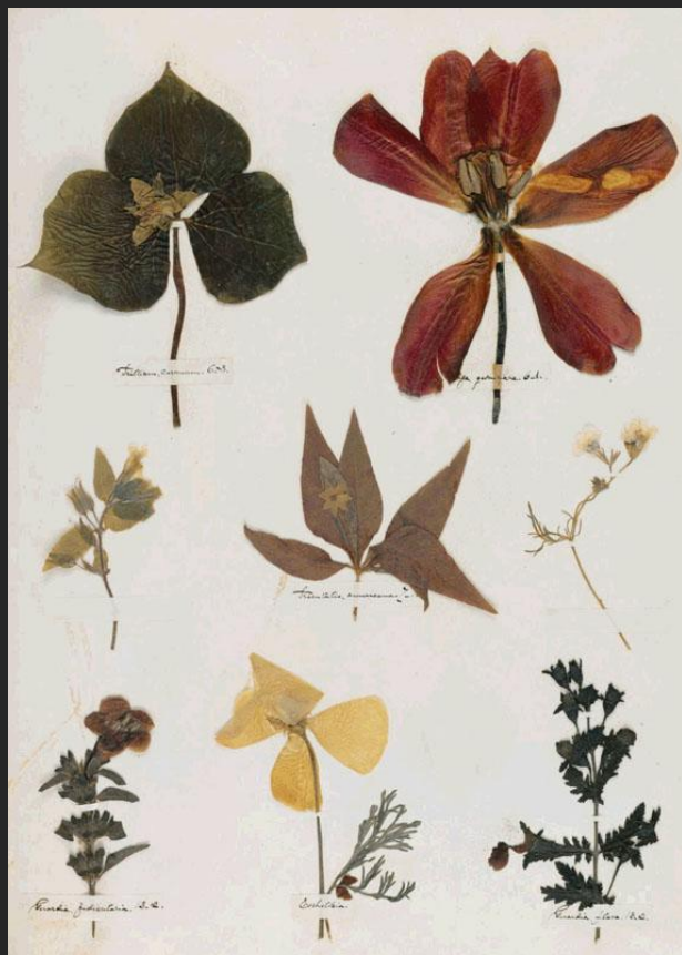
Гербарий Э. Дикинсон. 1840-е