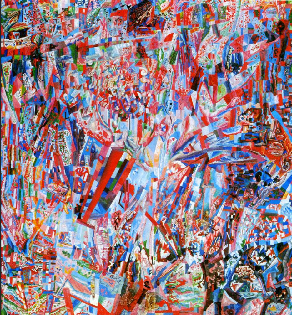
П. Филонов. Формула весны. Начало 1920-х

Не видя подлинника, трудно почувствовать нервность живописной ткани картины П. Филонова, волшебную игру света на полотнах К. Моне, магию «игры» со зрителем Р. Магритта.