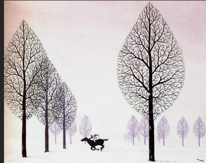
Р. Магритт. Зablудившийся жокей. 1926