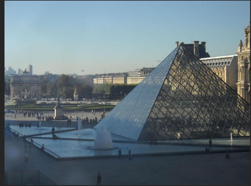
Йо Минг Пей. Стекланная пирамида Лувра. 1989