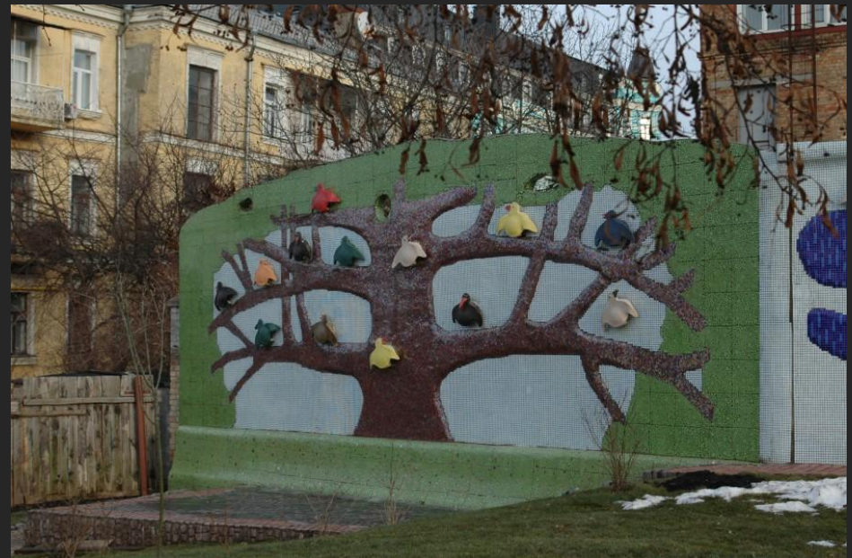
Детская площадка в Киеве. 2009