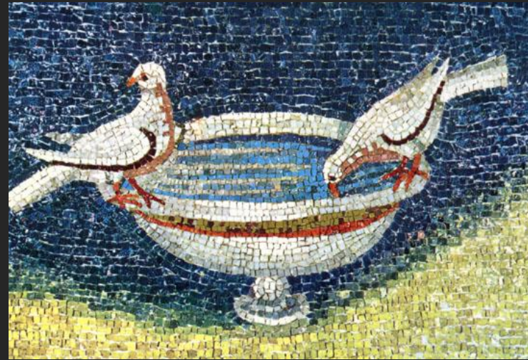
Мозаика в мавзолее Галлы Платидии. Середина V в.