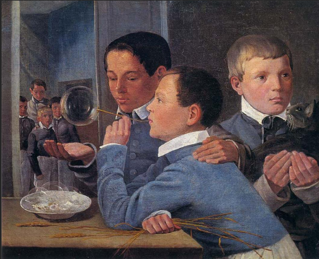
А. Иванов. Дети, пускающие мыльные пузыри. 1839