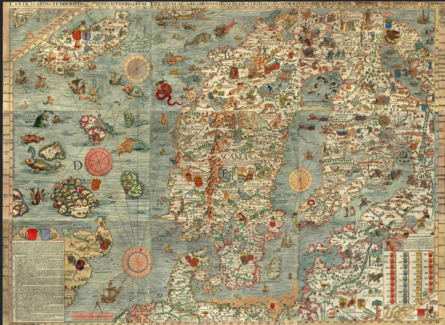
Морская карта Олауса Магнуса. XVI в.

Виртуальное образовательное путешествие по сайтам скандинавских музеев и археологов-любителей знакомит с культурой скандинавских народов.