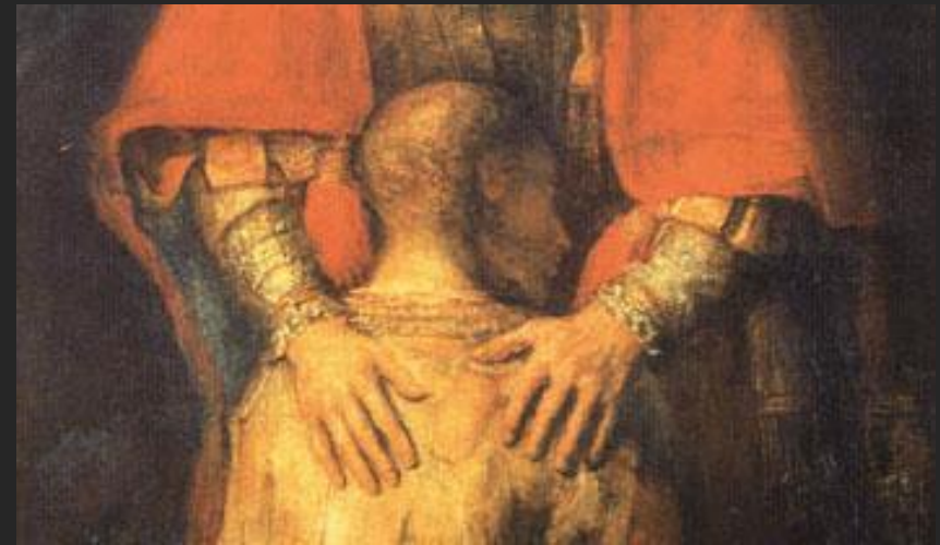
Зал Рембрандта в Эрмитаже; виртуальная возможность детализации