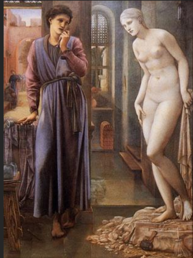
Э.Бёрн-Джонс. Пигмалион и Галатея. 1886