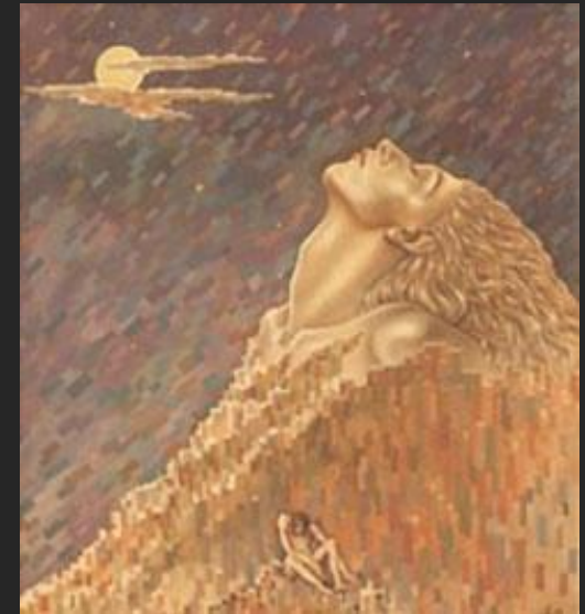
Н. Дулько. Пигмалион и Галатея. 2002