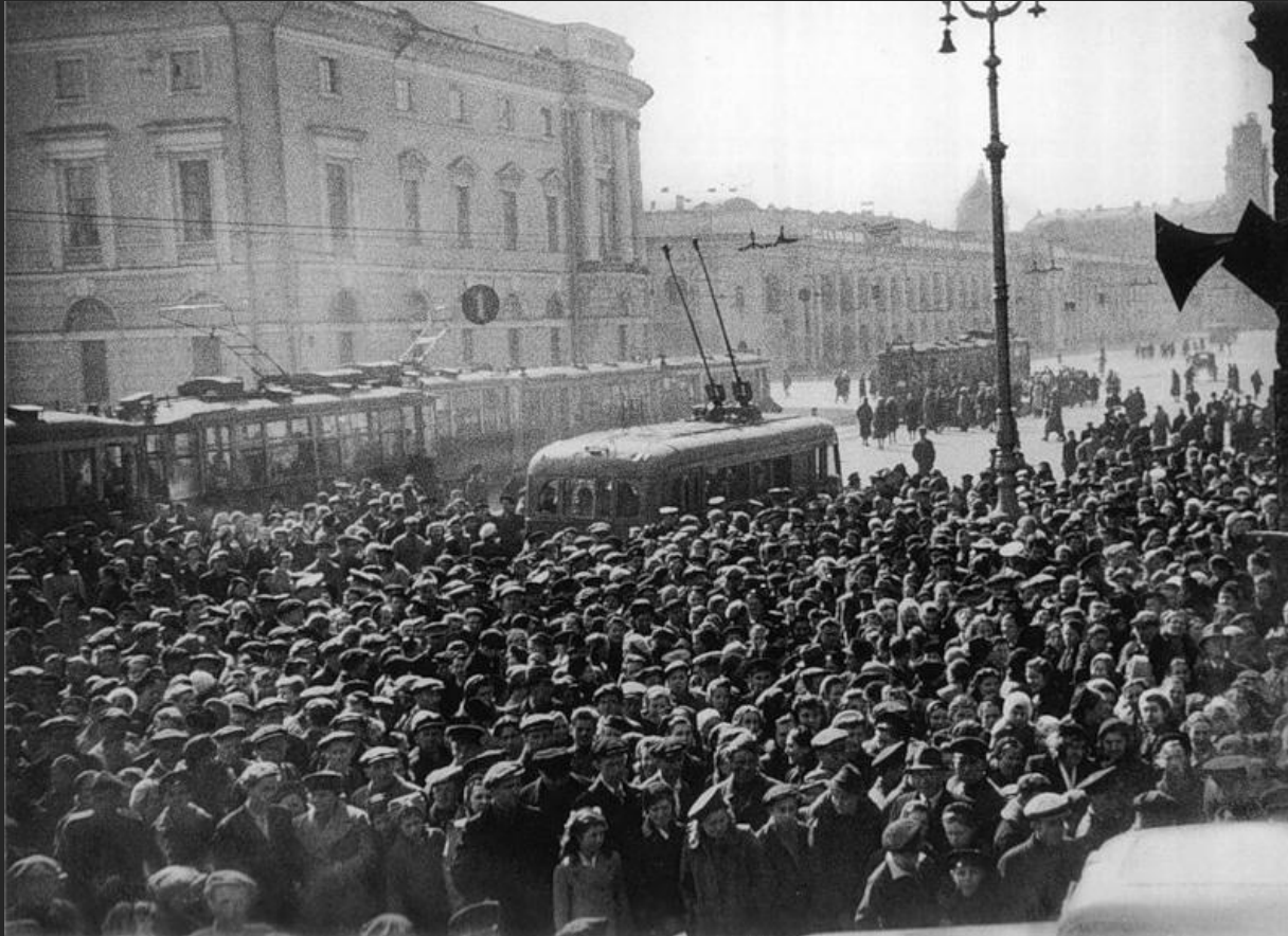
Ленинградцы на Невском пр. слушают сообщение по радио о капитуляции Германии