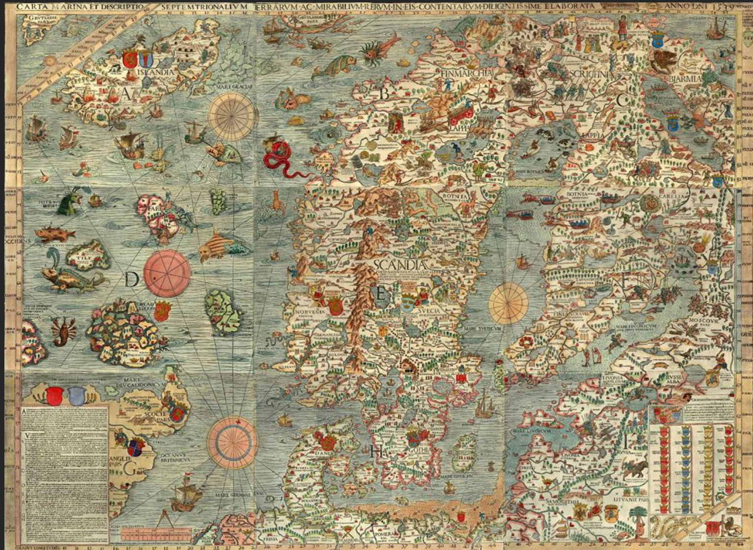
Морская карта Олауса Магнуса. XVI в.

Виртуальное образовательное путешествие по сайтам скандинавских музеев и археологов-любителей знакомит с культурой скандинавских народов.