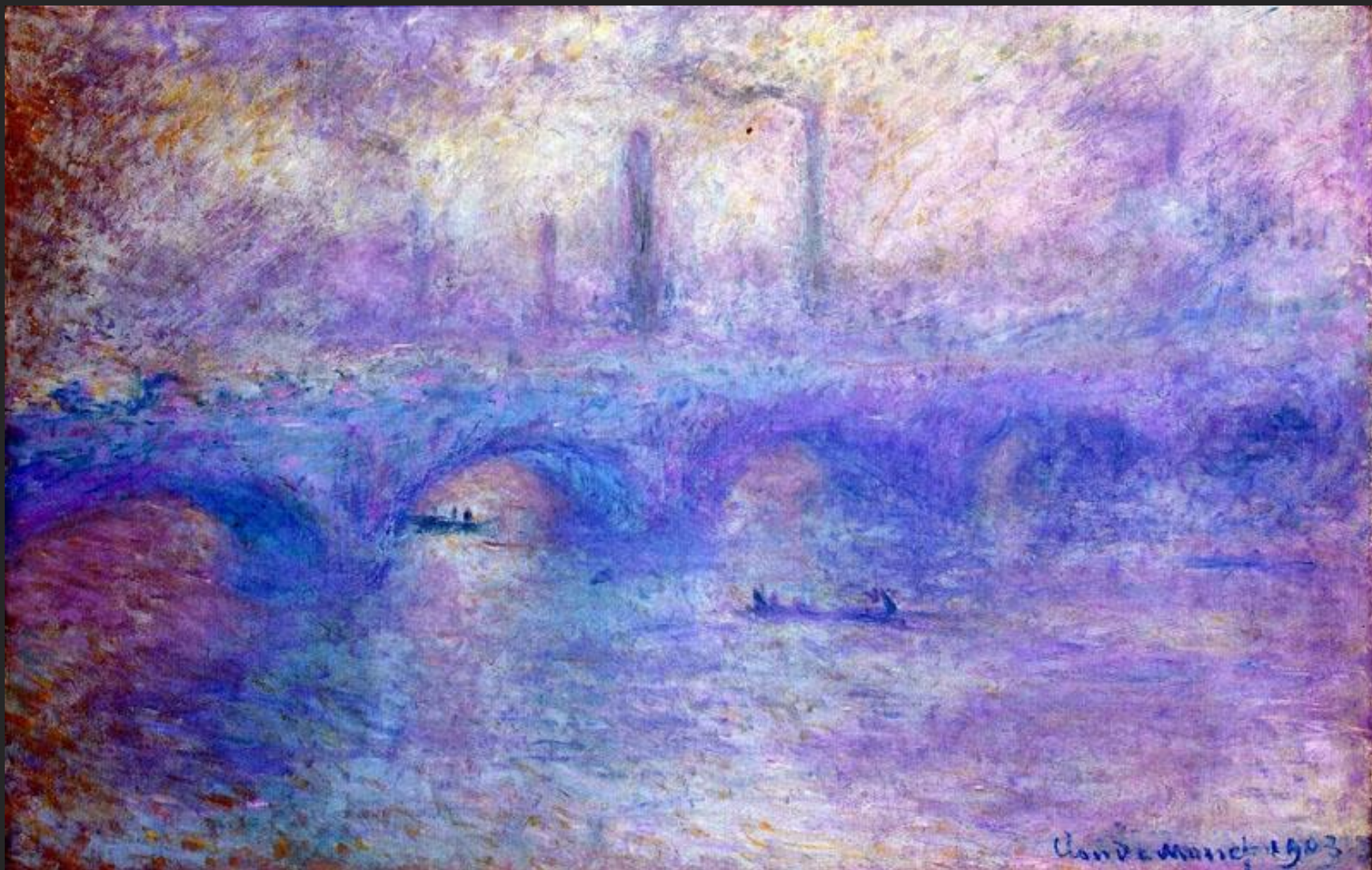
К. Моне. Мост Ватерлоо. Эффект тумана. 1903