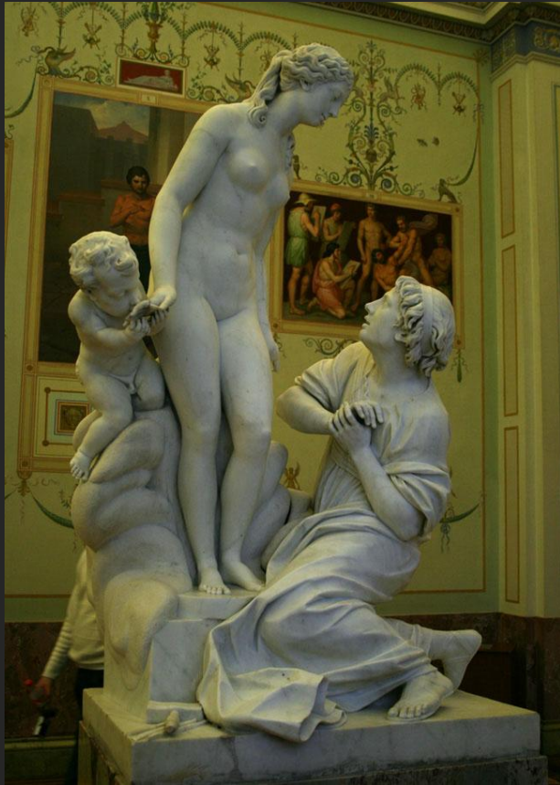
Э.М. Фальконе. Пигмалион, Галатея и Эрос. 1763

Собирательным образом творчества могут стать бессмертные образы Пигмалиона и Галатеи.