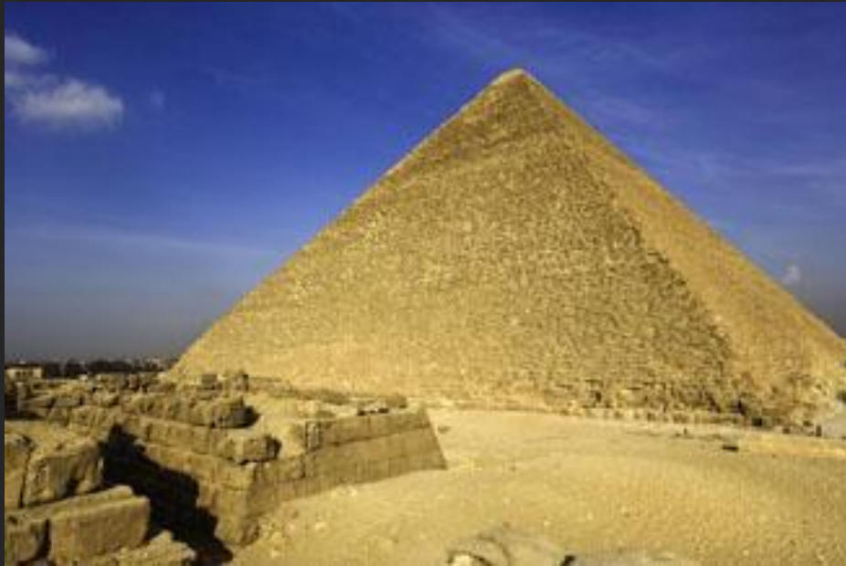
Пирамида Хеопса. 2560 –2540 до н. э.

Современный ученический реферат приобретает совершенно новое качество, сменяя приоритеты со сбора информации – на ее анализ, сопоставление источников и формулировку собственных выводов.