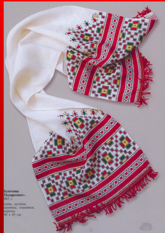
Полотенце «Подарочное». 003 г.

В элементах орнамента чувашской вышивки ученые-исследователи обнаружили знаки древней письменности. Изображения бытия в виде Древа жизни и первобытные понятия о Земле, небесном своде и светилах прерастали здесь в геометрических линиях и пропорциях узорного шитья.