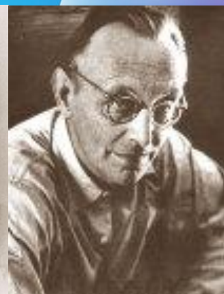
Рихард Вагнер 1813-1883