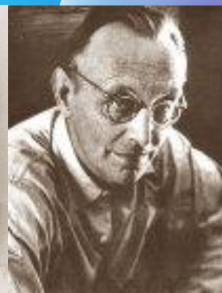
Рихард Вагнер 1813-1883