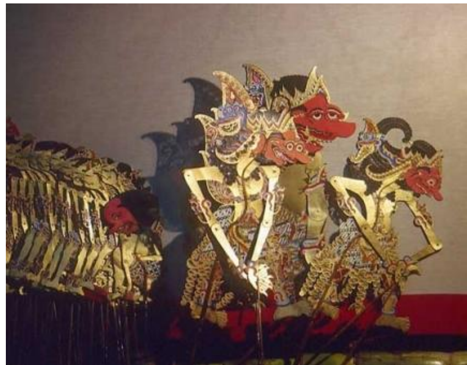
Индонезийский теневой театр ваянг-кулит.