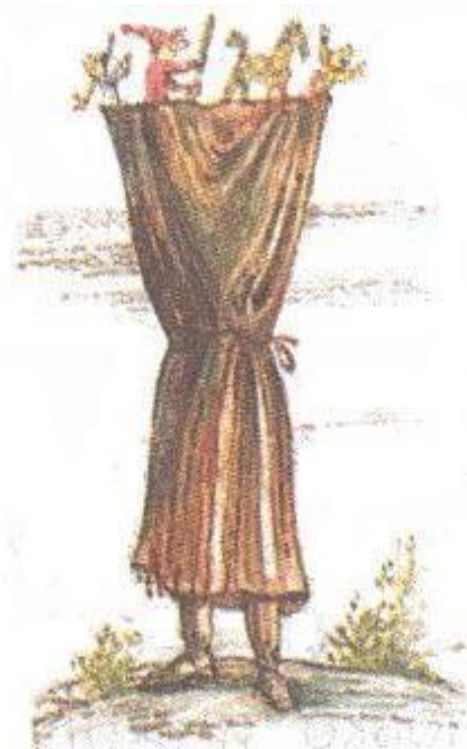
Ширма русского петрушечника

Театр верховых кукол (перчаточных, гапитно-тростевых и кукол иных конструкций), управляемых снизу. Актёры-кукловоды в театрах этого типа обычно скрыты от зрителей ширмой, но бывает и так, что они не скрываются и видны зрителям целиком или на половину своего роста.