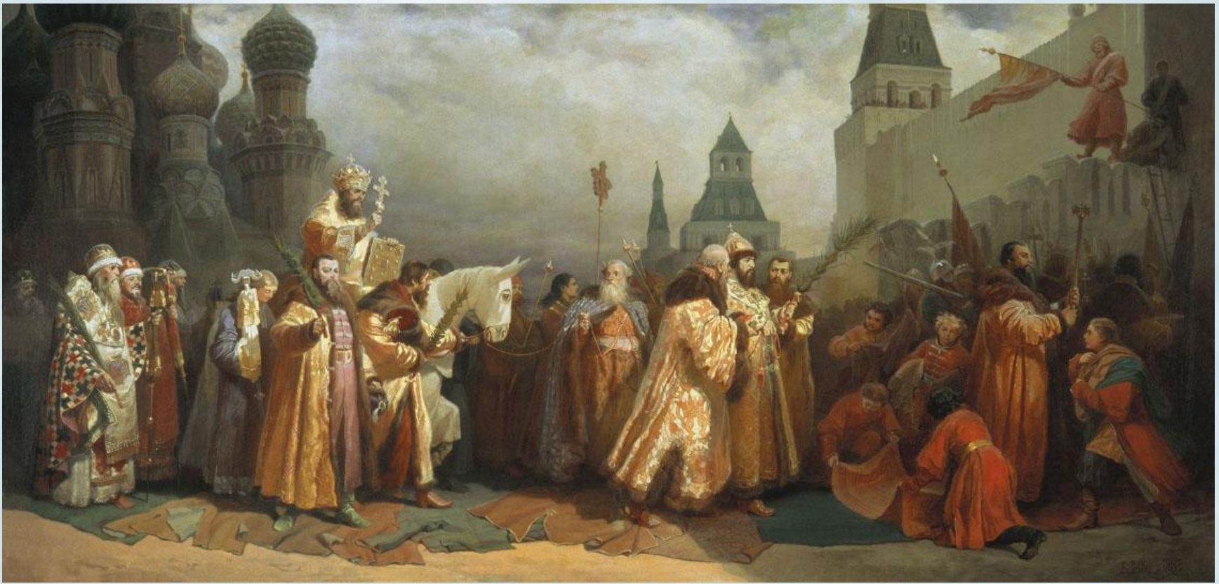
В. Г. Шварц «Шествие на осляти Алексея Михайловича» 1865.

На Руси в праздник Входа Господня в Иерусалим совершалось так называемое «шествие на осляти».