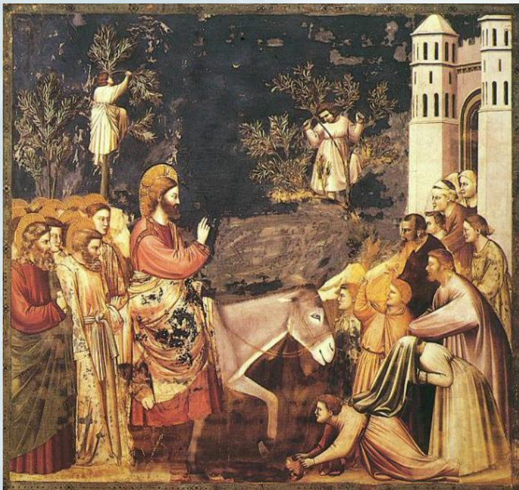
Джотто. Вход Господень в Иерусалим

Согласно Библии, В ЭТОТ день Иисус на молодом осле – символе кротости и миролюбия – торжественно въехал в ворота Иерусалима.