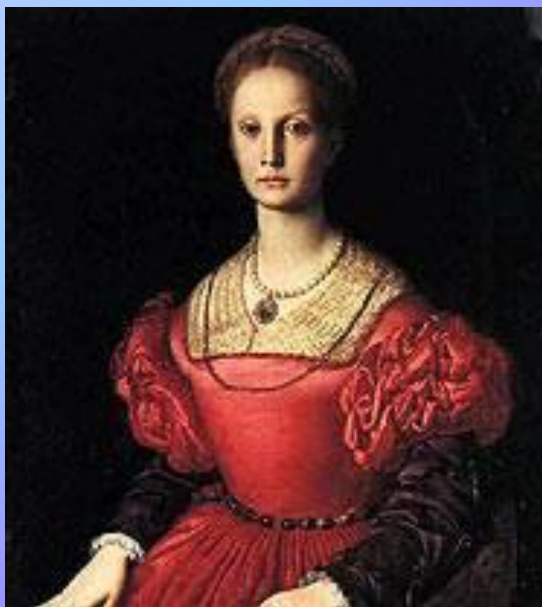
Портрет Лукреции Пачиатичи.