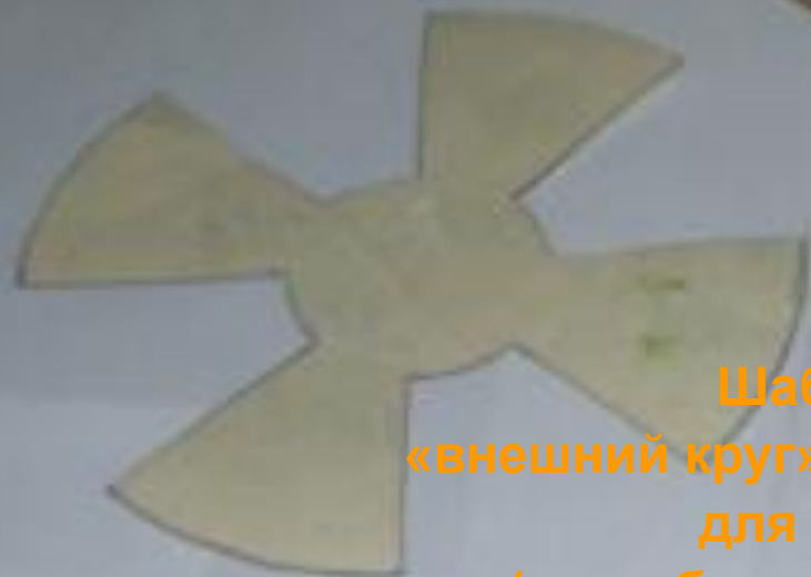
Шаблоны «внешний круг» и «внутренний круг» для цветка ( цвет бумаги по выбору)