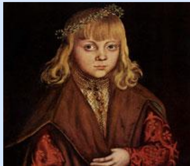
Принц Саксонии, 1517 Кранах Лукас (18)