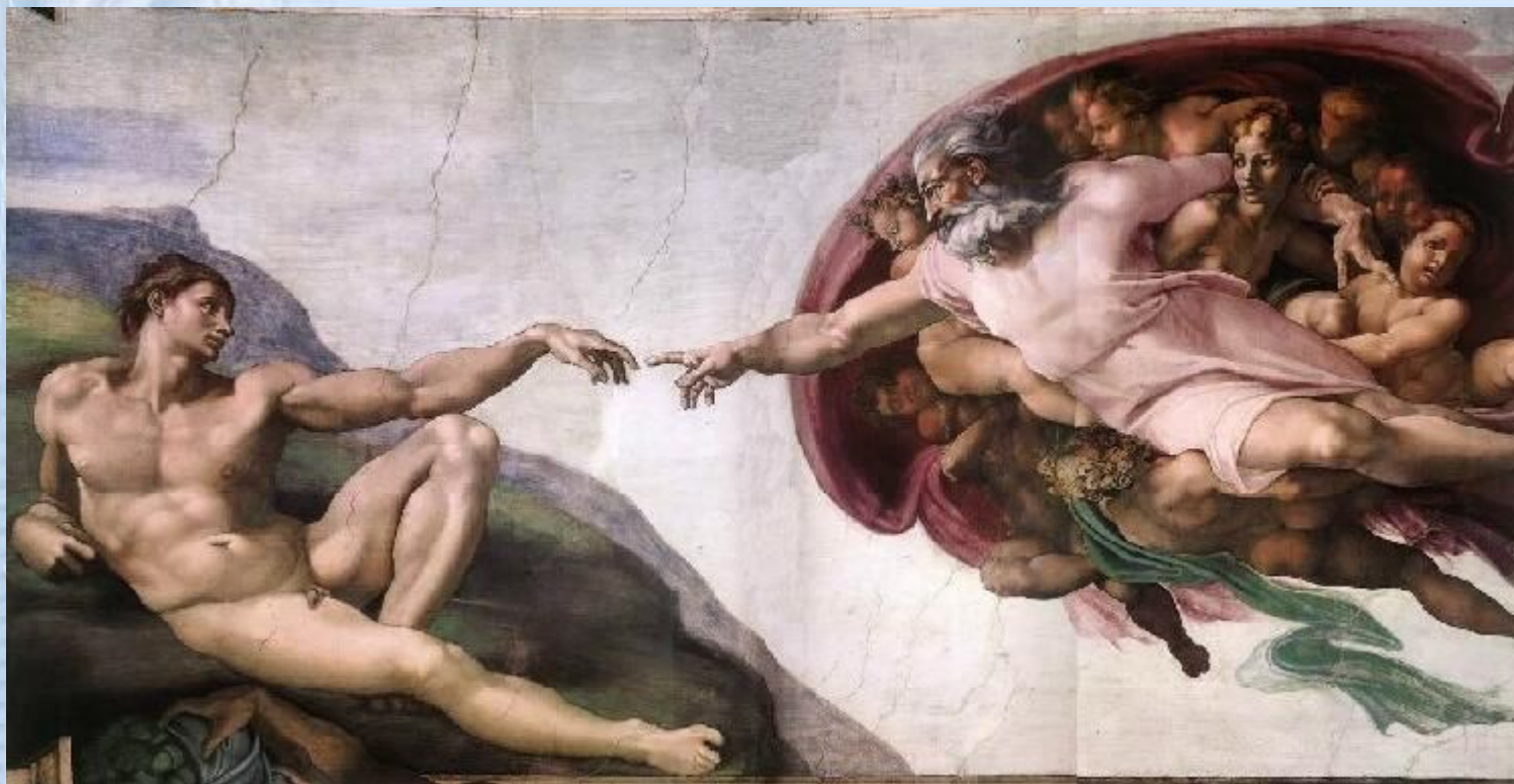
Микеланджело. Сотворение Адама. (12)