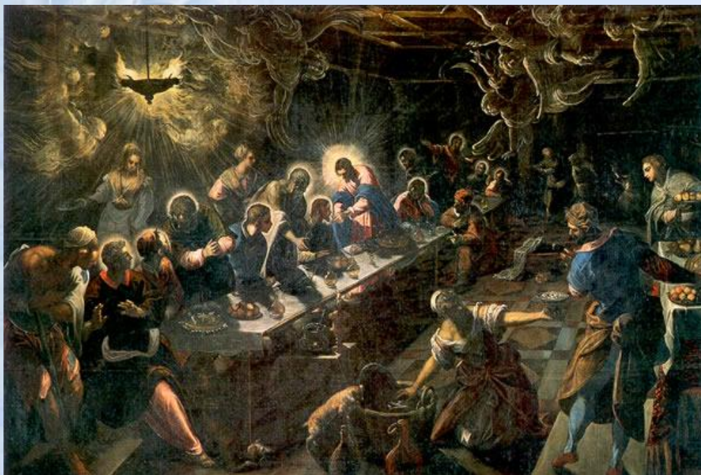
Венецианец Тинторетто в 1594 г. изобразил тайную вечерю как подпольную сходку в тревожных сумеречных отсветах (14)