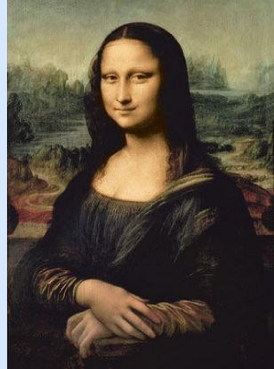
Леонардо Да Винчи «Мона Лиза» (2)