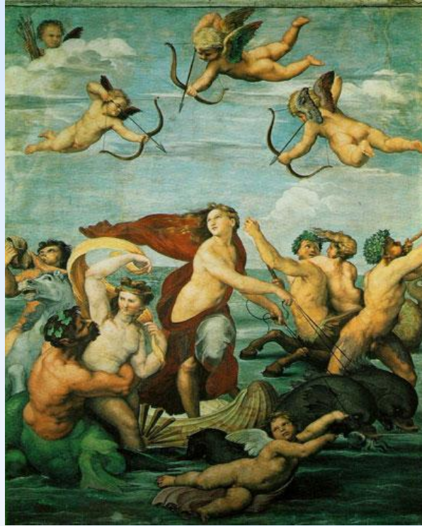
Рафаэль Санти: «Нимфа Галатея» (1)