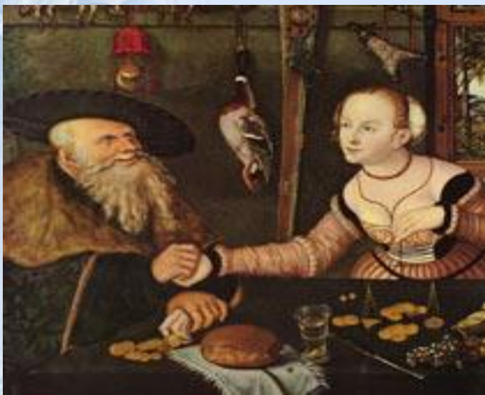
Мезальянс 1532 Кранах Лукас (17)