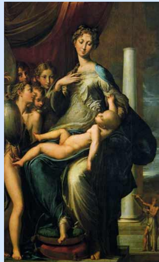
Мадонна с длинной шеей. Пармиджанино (15)