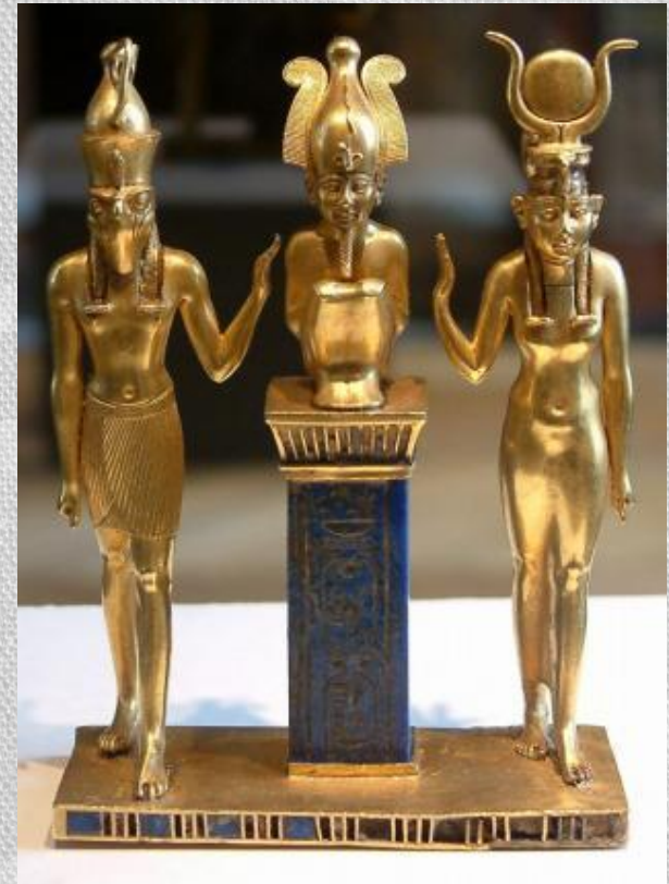
Гор, Осирис и Изида