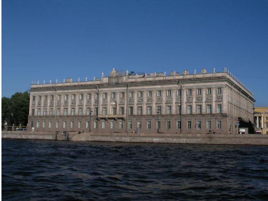
Мраморный дворец, построенный для Г.Г. Орлова

Императоры приказывали строить дворцы и для своих фаворитов. По приказу Екатерины II Мраморный дворец был построен для Г. Орлова