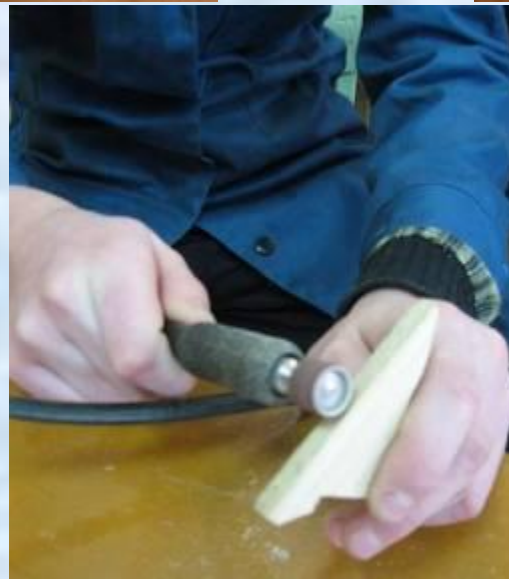
Правка и шлифовка поверхности деталей