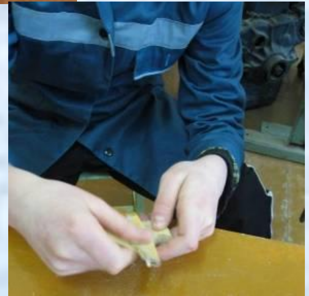
Окончательная зачистка деталей изделия