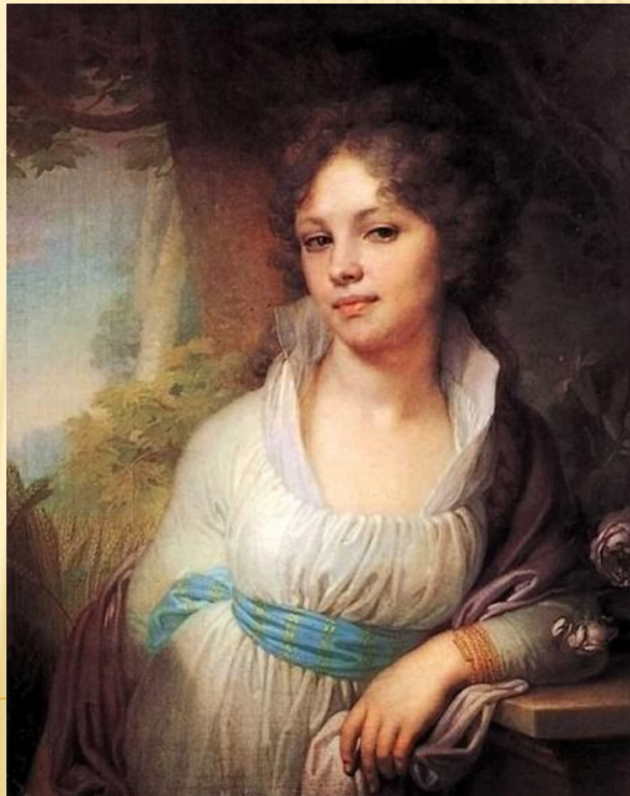
В.Л. Боровиковский. Портрет М.И.Лопухиной

ПРЕКРАСНА ТЫ В ВЛАСАХ СВОИХ, ХОТЬ ИХ НИКАК НЕ УБИРАЕШЬ, НО ТЫ НАРЯД ТАКОЙ ЛИШЬ ЛЮБИШЬ, В КОТОРОМ НЕЖНОСТЬ ПРОСТОТЫ БЛЕСТИТ ОТ СИЛЫ КРАСОТЫ Ф.ДМИТРИЕВ- МАМОНОВ