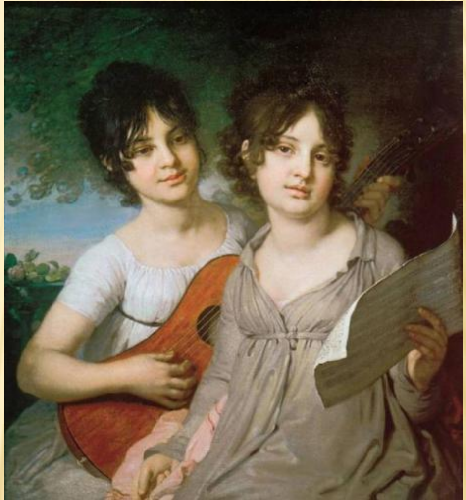
В.Л.БОРОВИКОВСКИЙ ПОРТРЕТ А.Г. И В.Г. ГАГАРИНЫХ. 1802 Г.

Живопись сентиментализма показывала “человека чувствительного”. Человек был примечателен не воинскими подвигами или государственными делами, а богатством души и сердца.