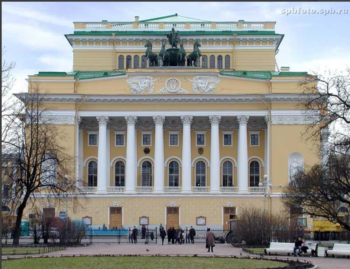
Александринский театр. Санкт-Петербург. 1832 г.