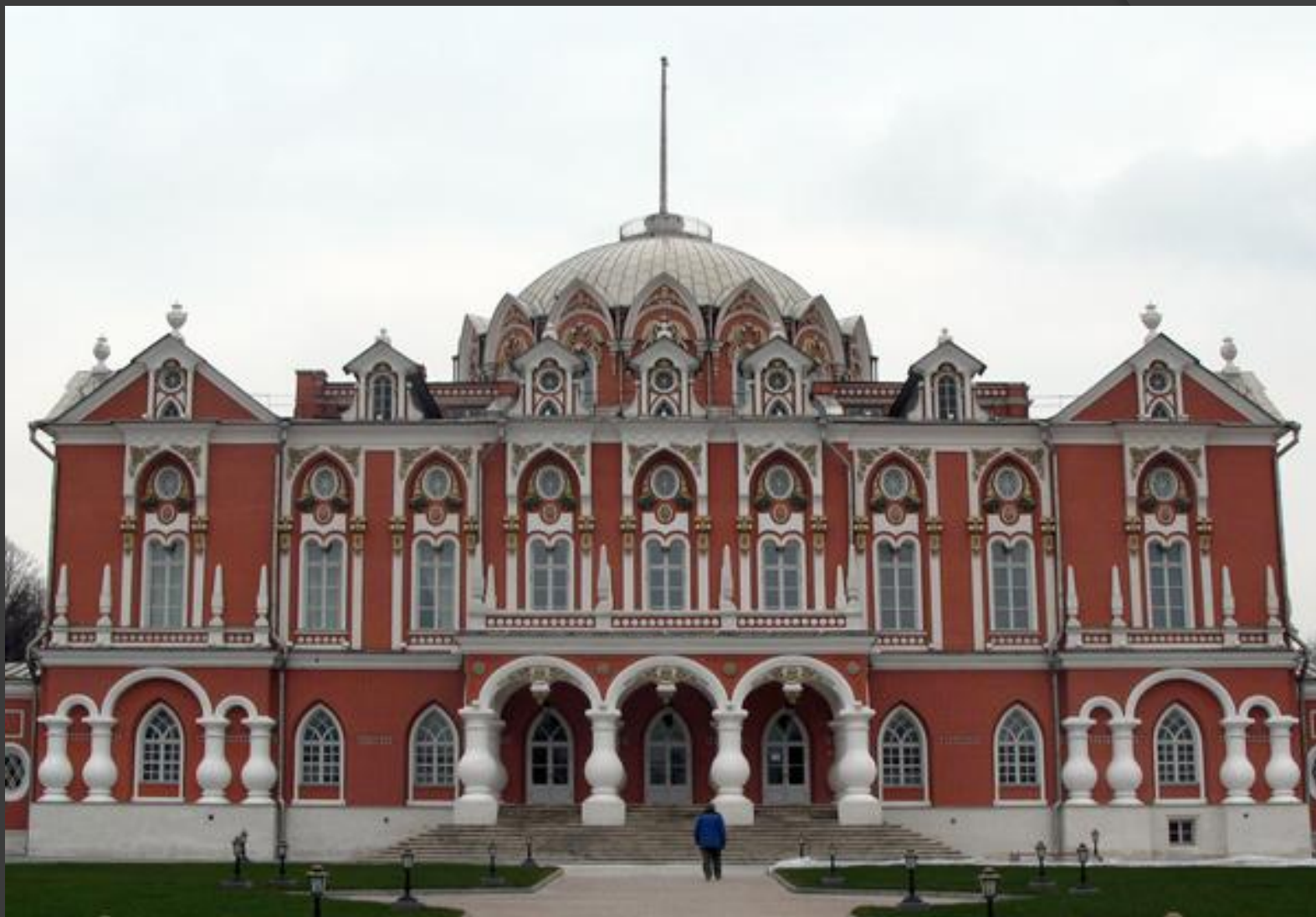
Петровский дворец. 1775 – 1782 гг. Москва.