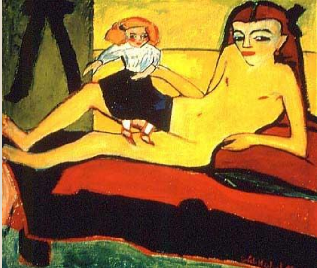
ЭРИХ ХЕККЕЛЬ. ДЕВОЧКА С КУКЛОЙ

Художественный язык был обусловлен установкой на своеобразную интуитивную “варварскую” непосредственность: тяжелые массы пастозных мазков, положенные на крупнозернистые холсты в черных рамах. В картинах выражено предчувствие какого-то ужаса через деформацию предметов, природных форм, как бы разрушается и дискредитируется все, что казалось незыблемым. Художники обращаются к литературным темам, иллюстрируют романы Ф.М. Достоевского. ( Э.Хеккель “Двое мужчин за столом”, 1912г. Литературная подоснова: “Идиот”, сцена первого визита князя Мышкина в дом Рогожина.)