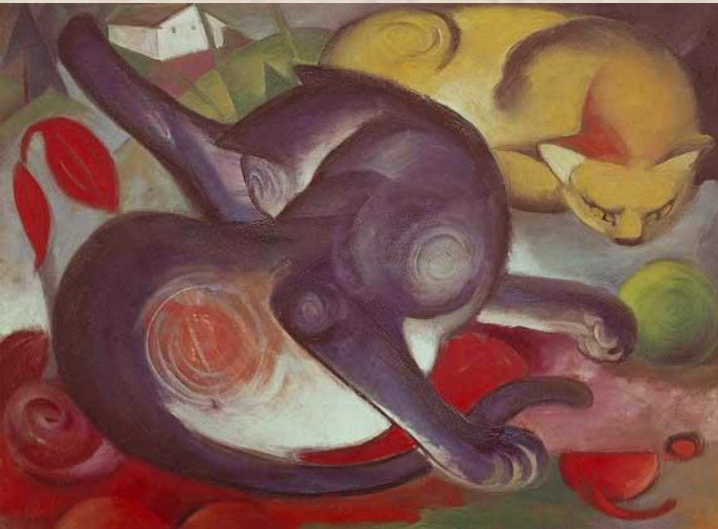
ФРАНЦ МАРК. ДВЕ КОШКИ