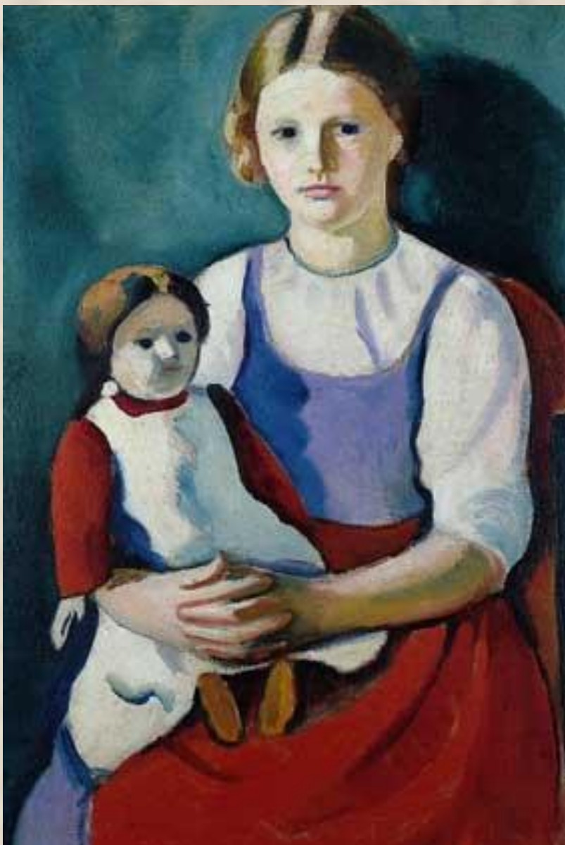
АВГУСТ МАККЕ. ДЕВУШКА С КУКЛОЙ