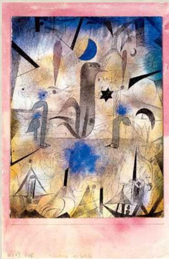
ПАУЛЬ КЛЕЕ. ПРЕДУПРЕЖДЕНИЕ КОРАБЛЕЙ. 1917

В экспрессионизме выделяют два периода: до первой мировой войны и после.