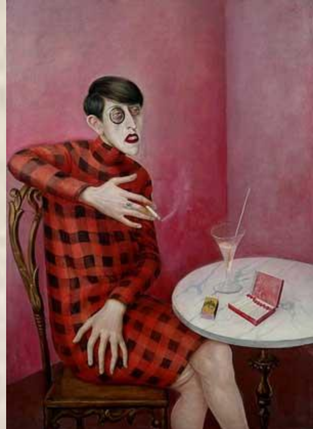
ОТТО ДИКС. ПОРТРЕТ СИЛЬВИИ ФОН ХАРДЕН. 1926

• Второй период: экспрессионизм периода первой мировой войны и в послевоенные годы.