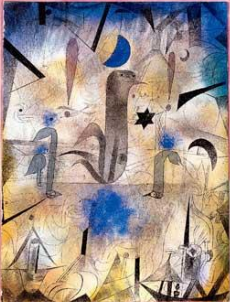
ПАУЛЬ КЛЕЕ. ПРЕДУПРЕЖДЕНИЕ КОРАБЛЕЙ. 1917