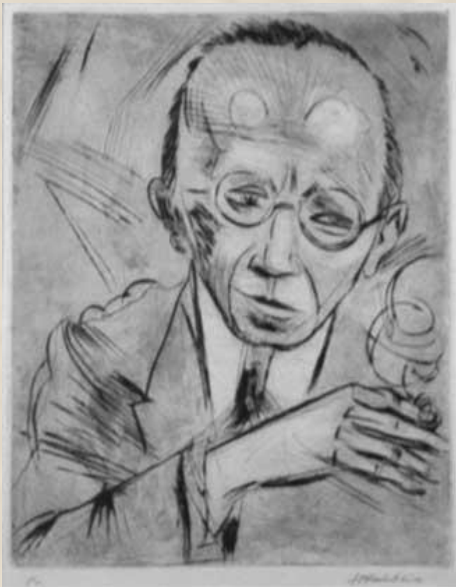
МАКС ПЕХШТЕЙН. КРИТИК