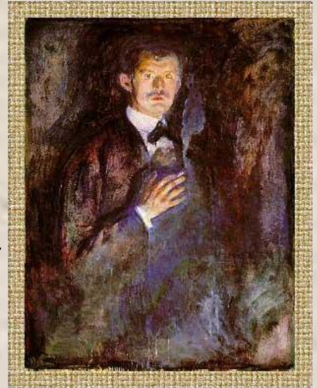
ЭДВАРД МУНК. АВТОПОРТРЕТ