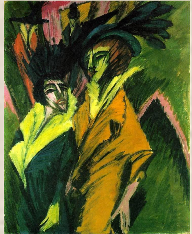
Ernst Ludwig Kirchner Two Women in the Street 1914