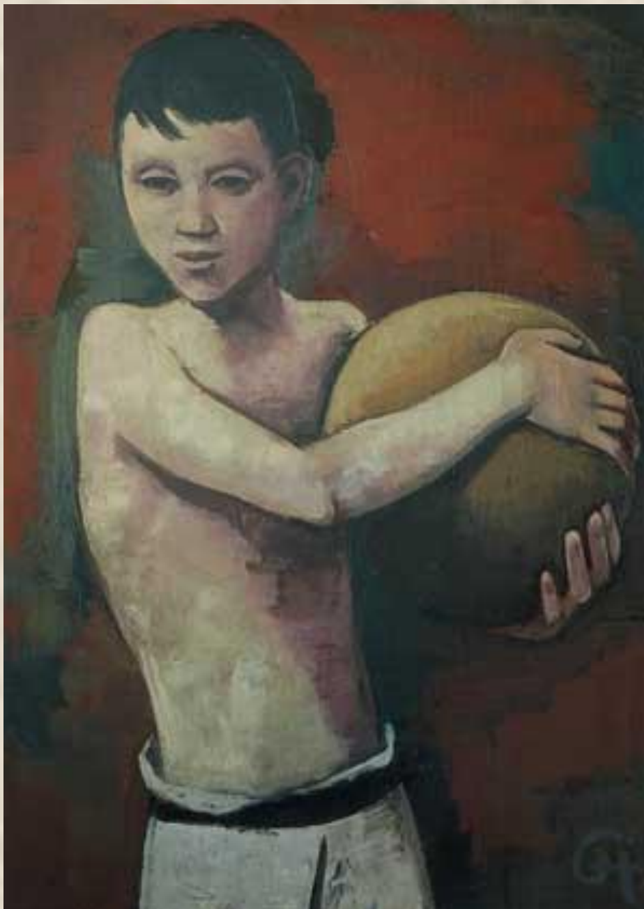
КАРЛ ХОФЕР. МАЛЬЧИК С МЯЧОМ