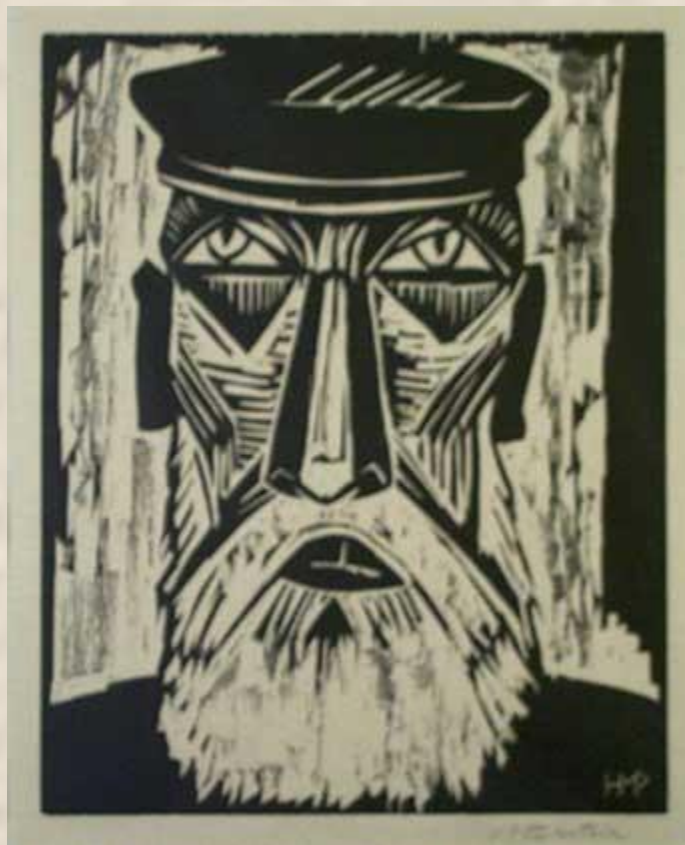
МАКС ПЕХШТЕЙН. ГОЛОВА БОРОДАТОГО РЫБАКА