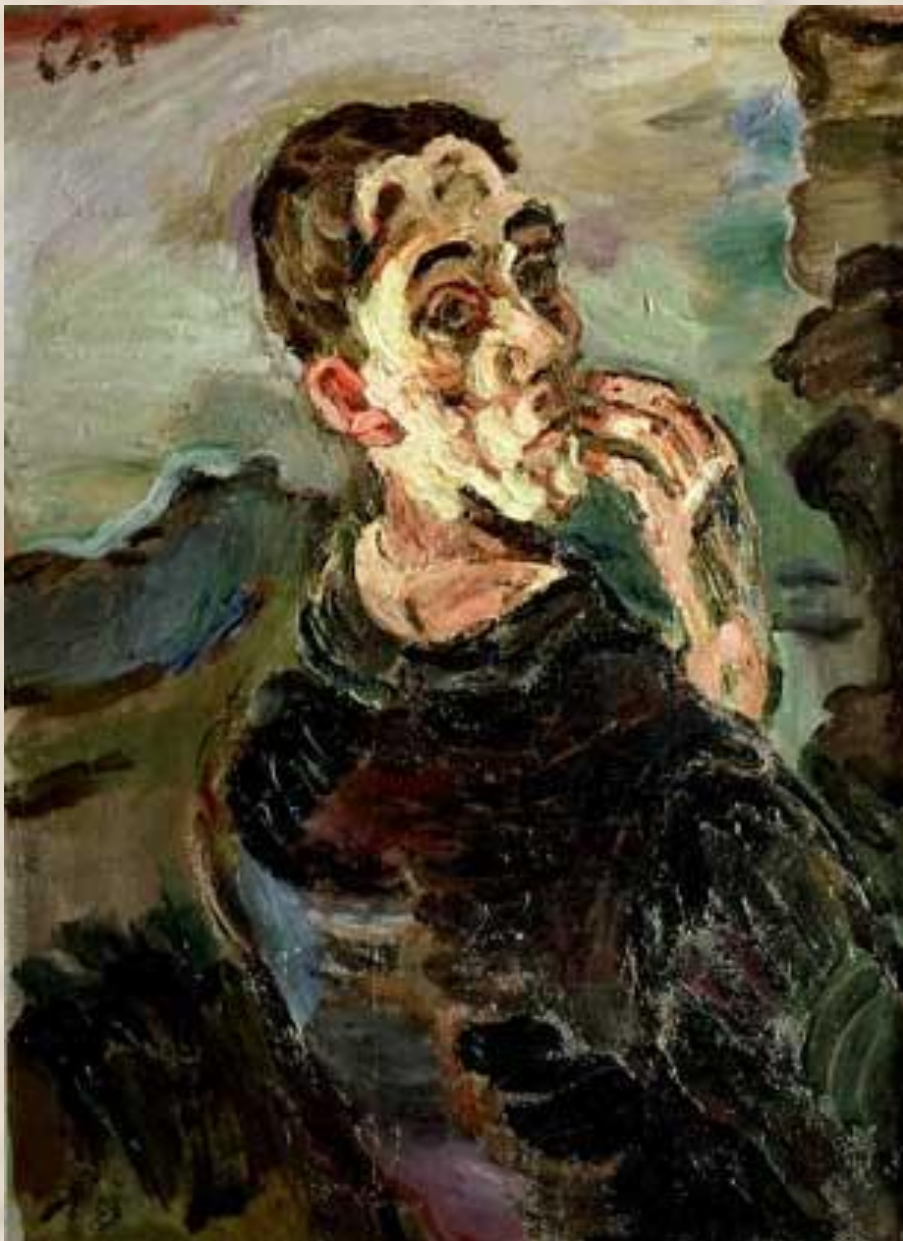
ОСКАР КОКОШКА. АВТОПОРТРЕТ. 1918–1919. Коллекция Рудольфа Леопольда, Вена.