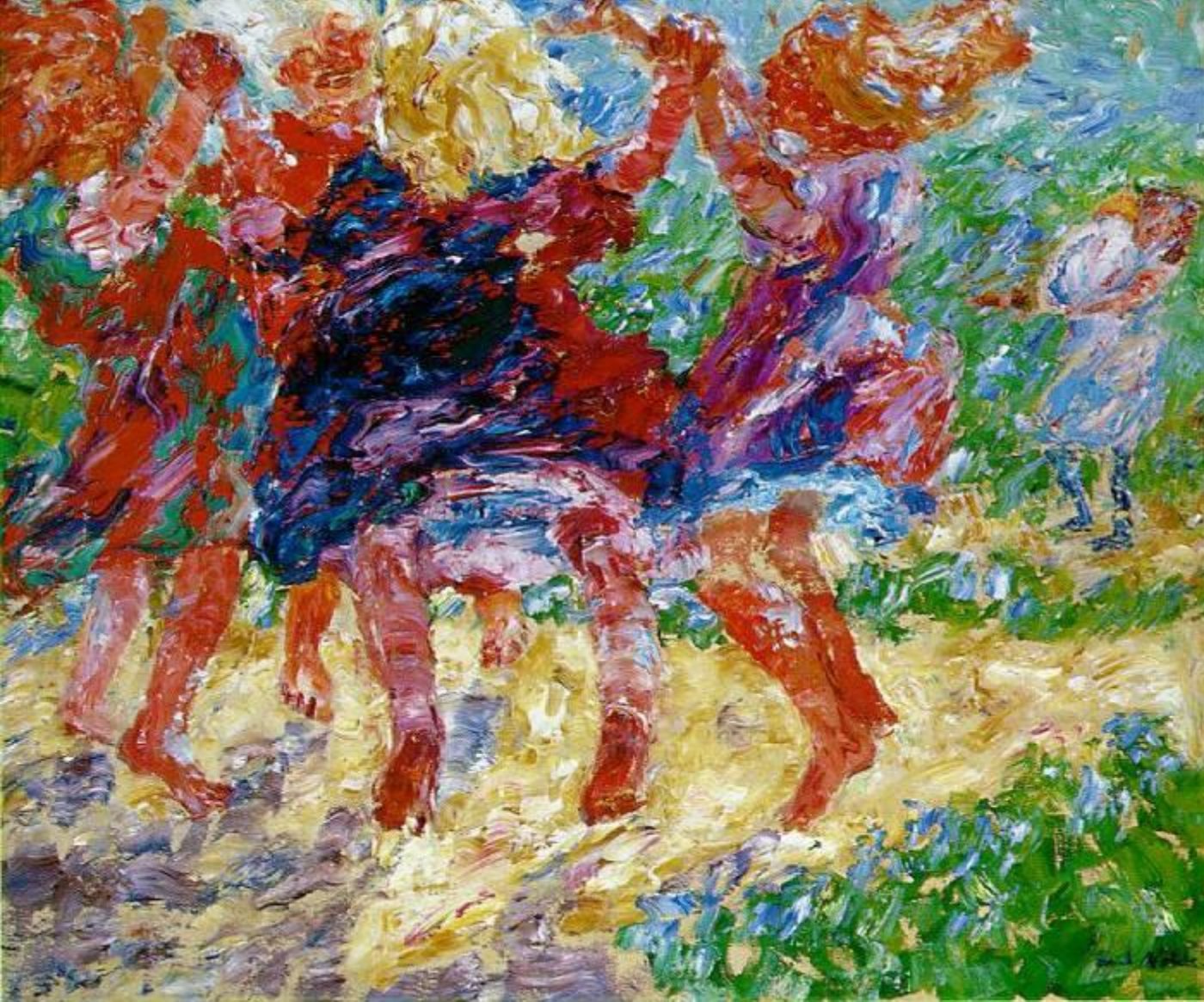
Эмиль Нольде Wildly Dancing Children 1909