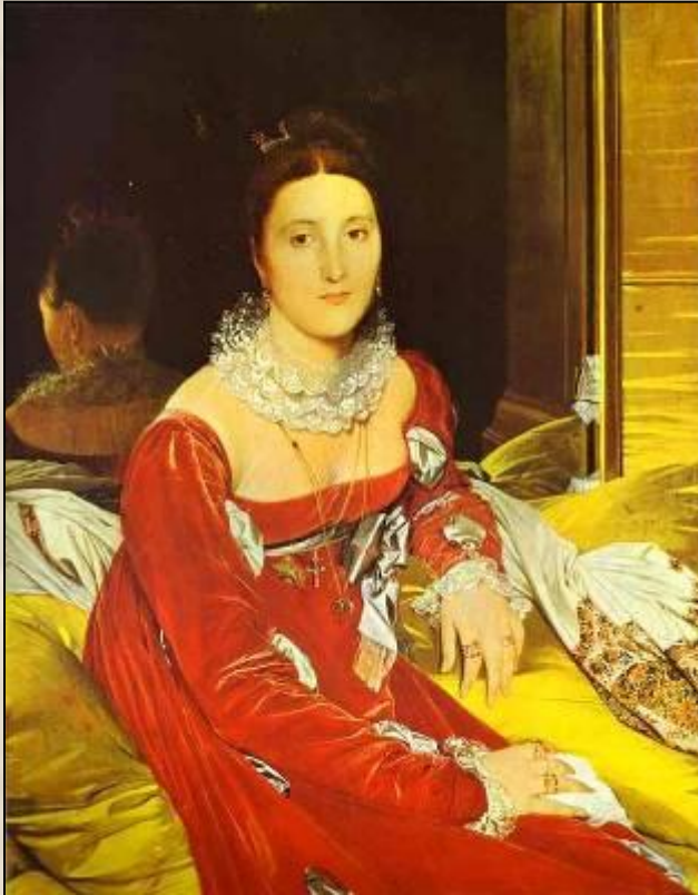
J.A.D. Ingres (1780-1867) "Madam de Senonnes portretas, 1814-16.