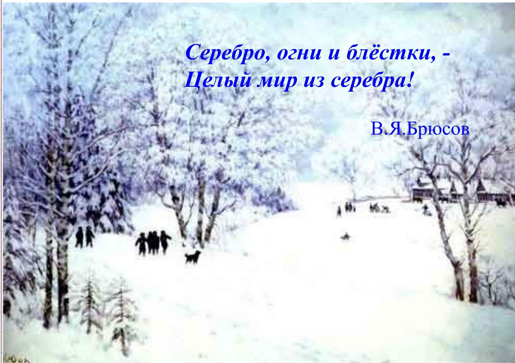
К.Юон. Русская зима