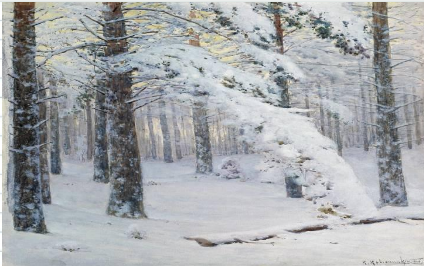
К.Я.Крыжицкий . «Лес зимой»

Тихо, беззвучно* в зимнем лесу и на лесных снежных полянах*. (И.Соколов- Микитов.)