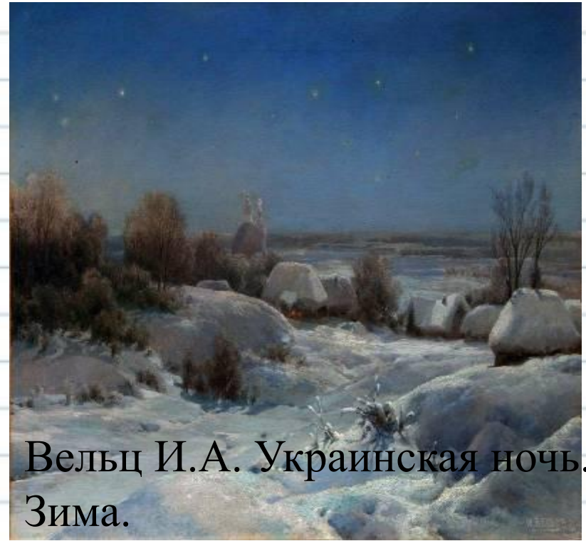
Вельц И.А. Украинская ночь. Зима.