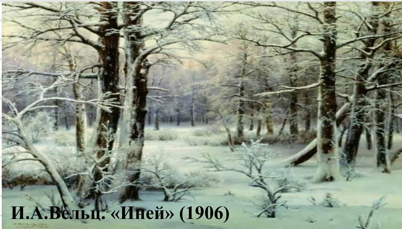
И.А.Вельц. «Иней» (1906)

Бриллианты в лунном свете, Бриллианты в небесах, Бриллианты на деревьях, Бриллианты на снегах. (А.А.Фет)