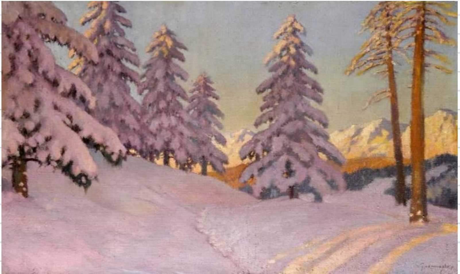
Гермашев М.М. «Лиловый снег»