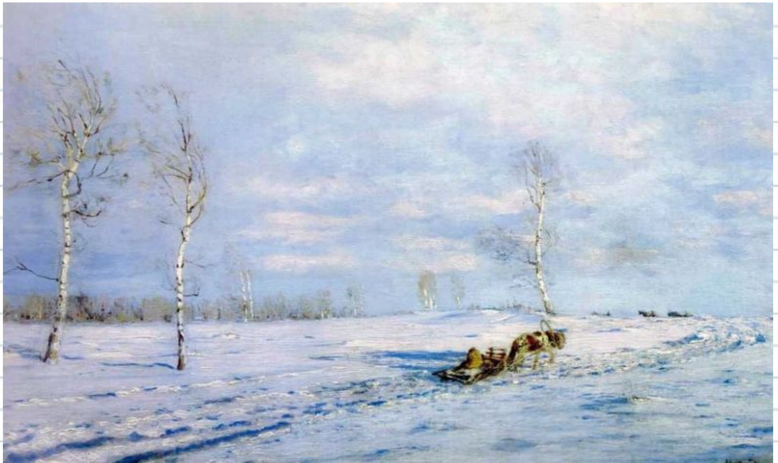
Н.Н.Дубовский. Санний путь

Еду. Тихо. Слышны* звоны под копытом на снегу. (С.А.Есенин.)