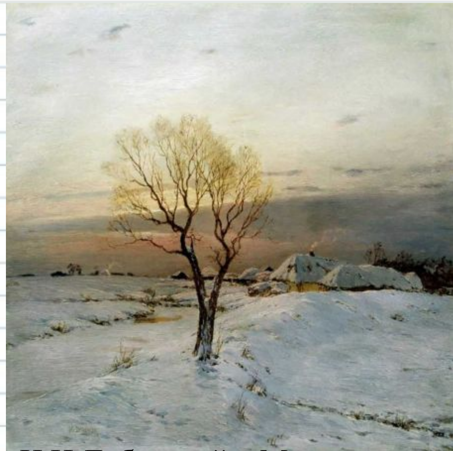
Н.Н.Дубовский. «Морозное утро» (1894)