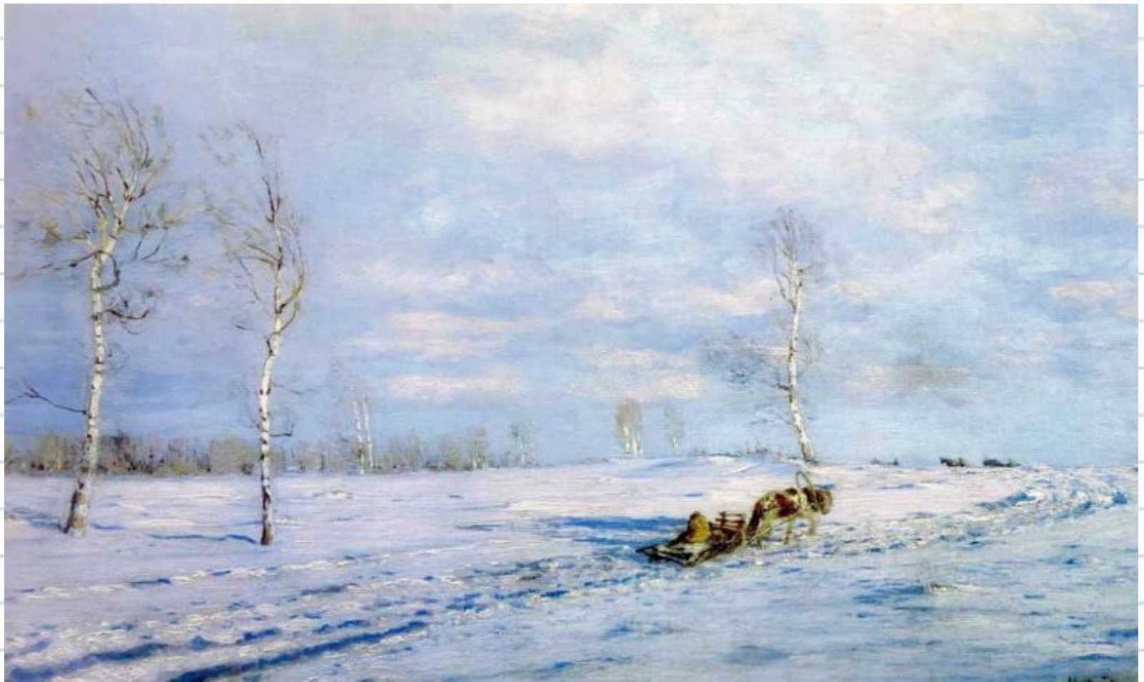
Н.Н.Дубовский. Санний путь

Еду. Тихо. Слышны* звоны под копытом на снегу. (С.А.Есенин.)