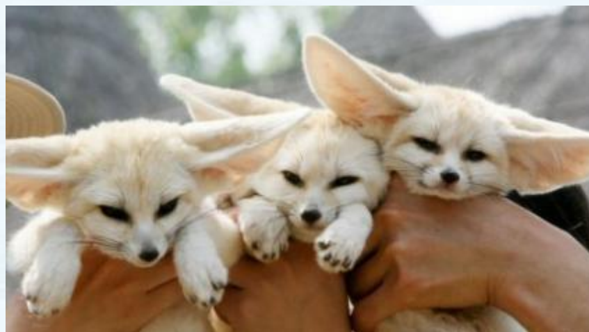
Лисички — лесные звери

ОМОНИМЫ — это слова, одинаковые по звучанию, но совершенно разные по лексическому значению