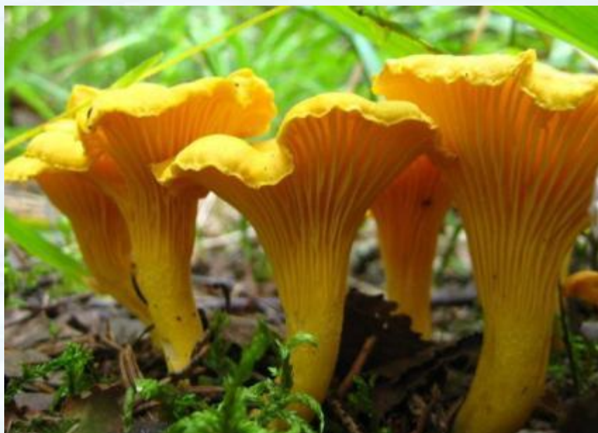
Лисички - грибы

В стихотворении речь идёт о совершенно разных словах – словах-антонимах