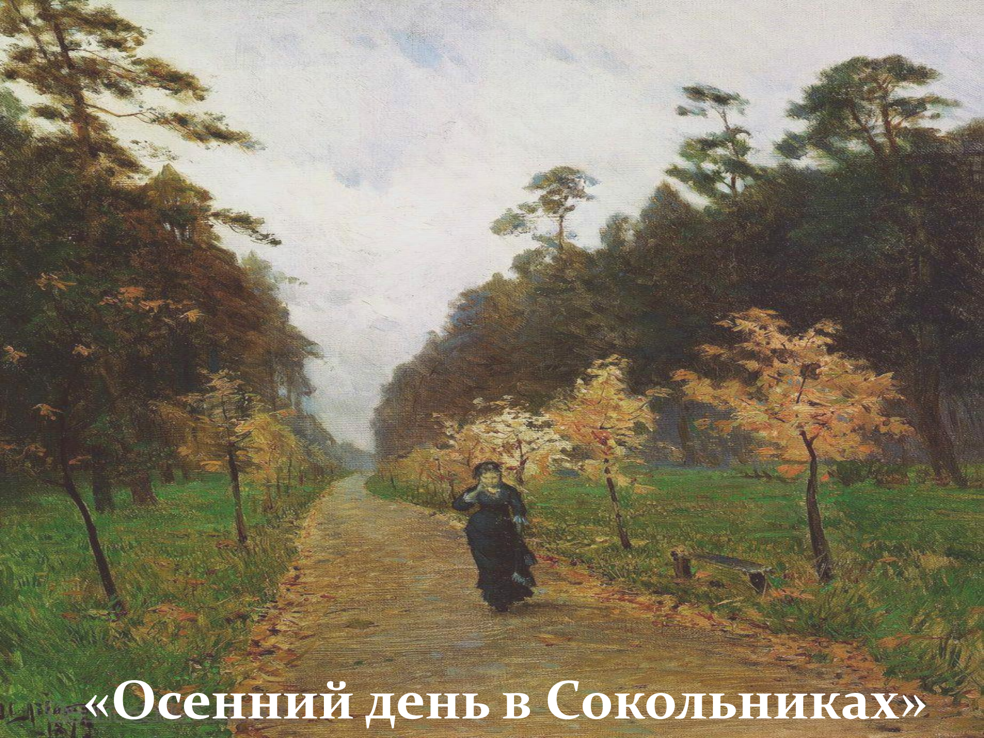
«Осенний день в Сокольниках»