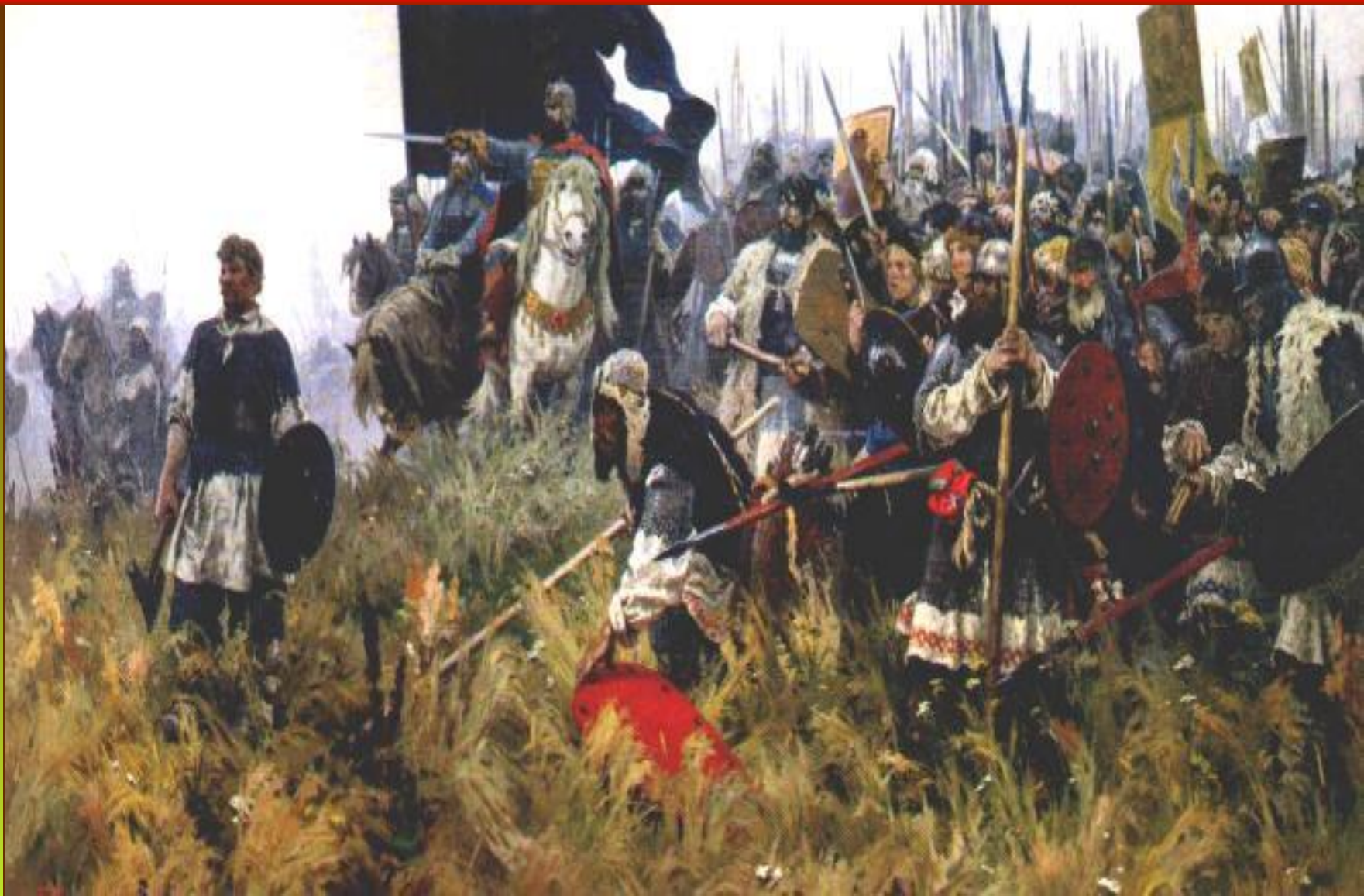
А.П.Бубнов " Утро на Куликовом поле". 1947 г. ГТГ