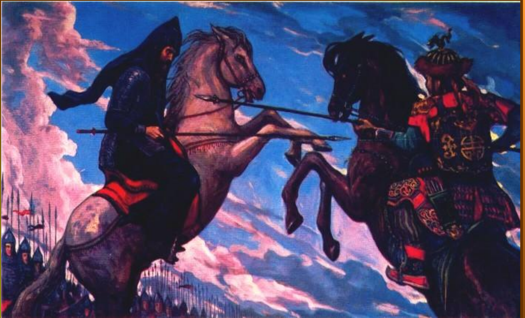
И.Глазунов. Поединок Пересвета с татарским богатырем Темир-Мурзой (Челубеем)