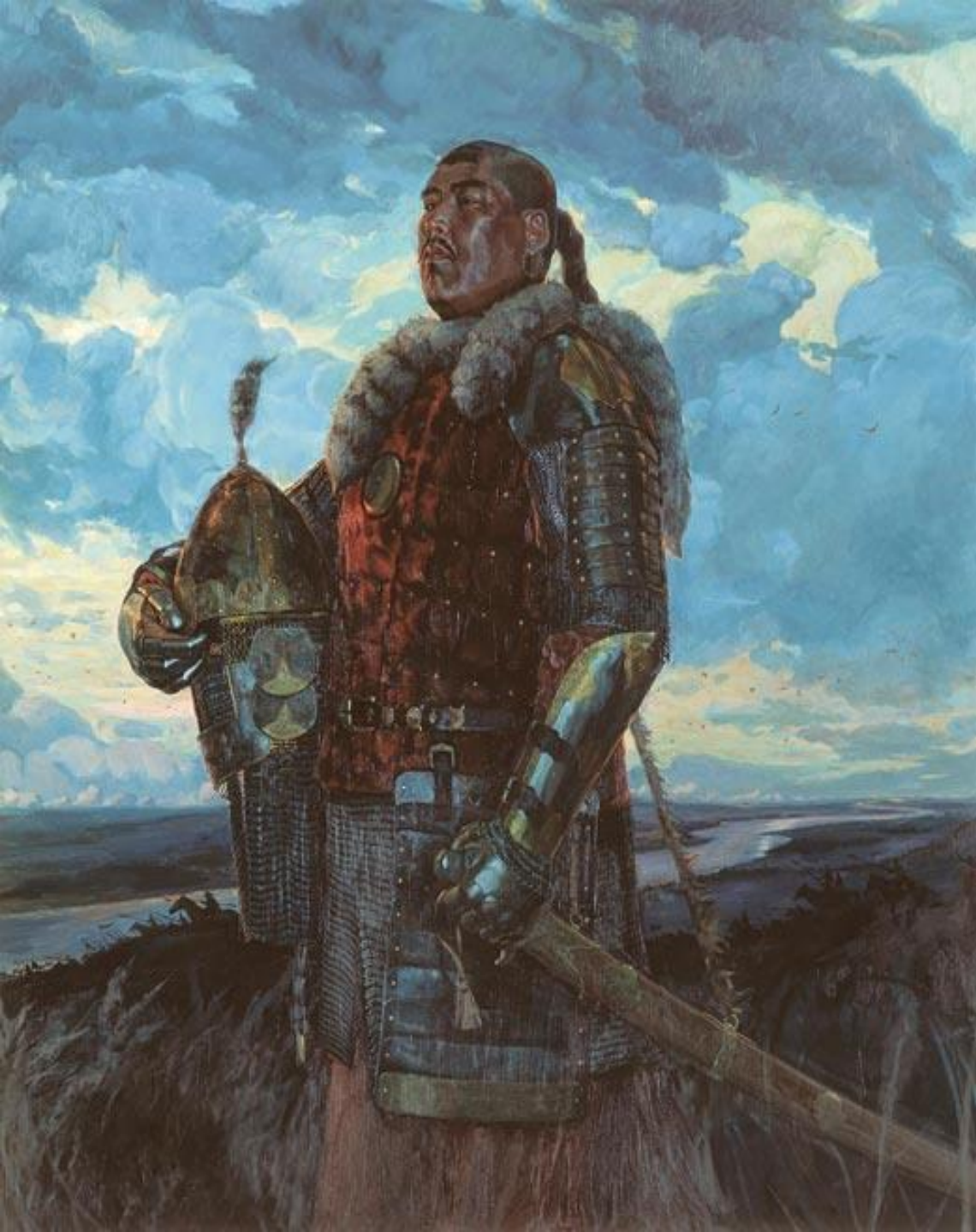
Хан Мамай. Дмитрий Моторин