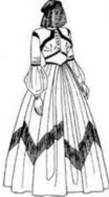
Рис. 9. Одежда стиля романтизм