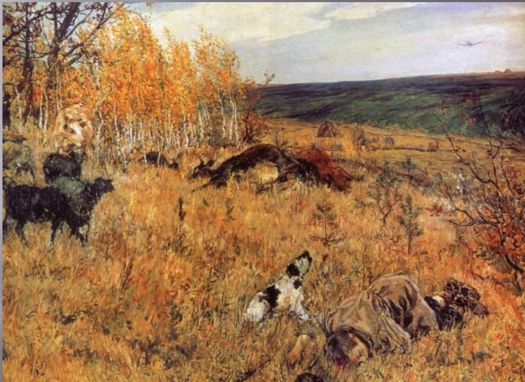
Пластов А. «Фашист пролетел» 1942