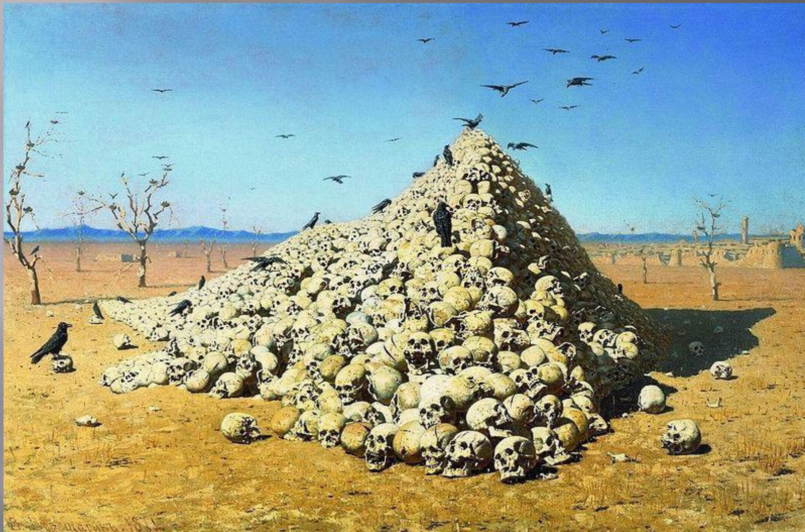
В. В. Верещагин. «Апофеоз войны» (1878)

Известнейшее полотно серии, «Апофеоз войны» (1870-71, Третьяковская галерея), — с грудой черепов на фоне пустынных, безжизненных горизонтов, — снабжено красноречивой надписью на раме: «Посвящается всем великим завоевателям: прошедшим, настоящим и будущим».