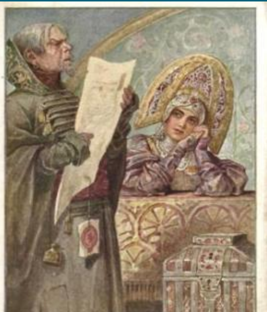
С. Соловьев. Писем