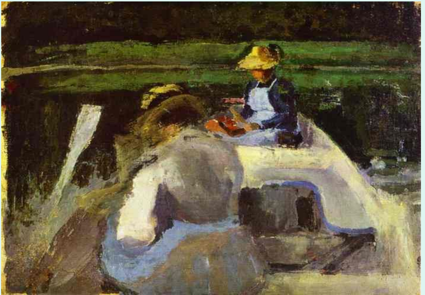
НА ЛОДКЕ 1982 БОРИСОВ- МУСАТОВ