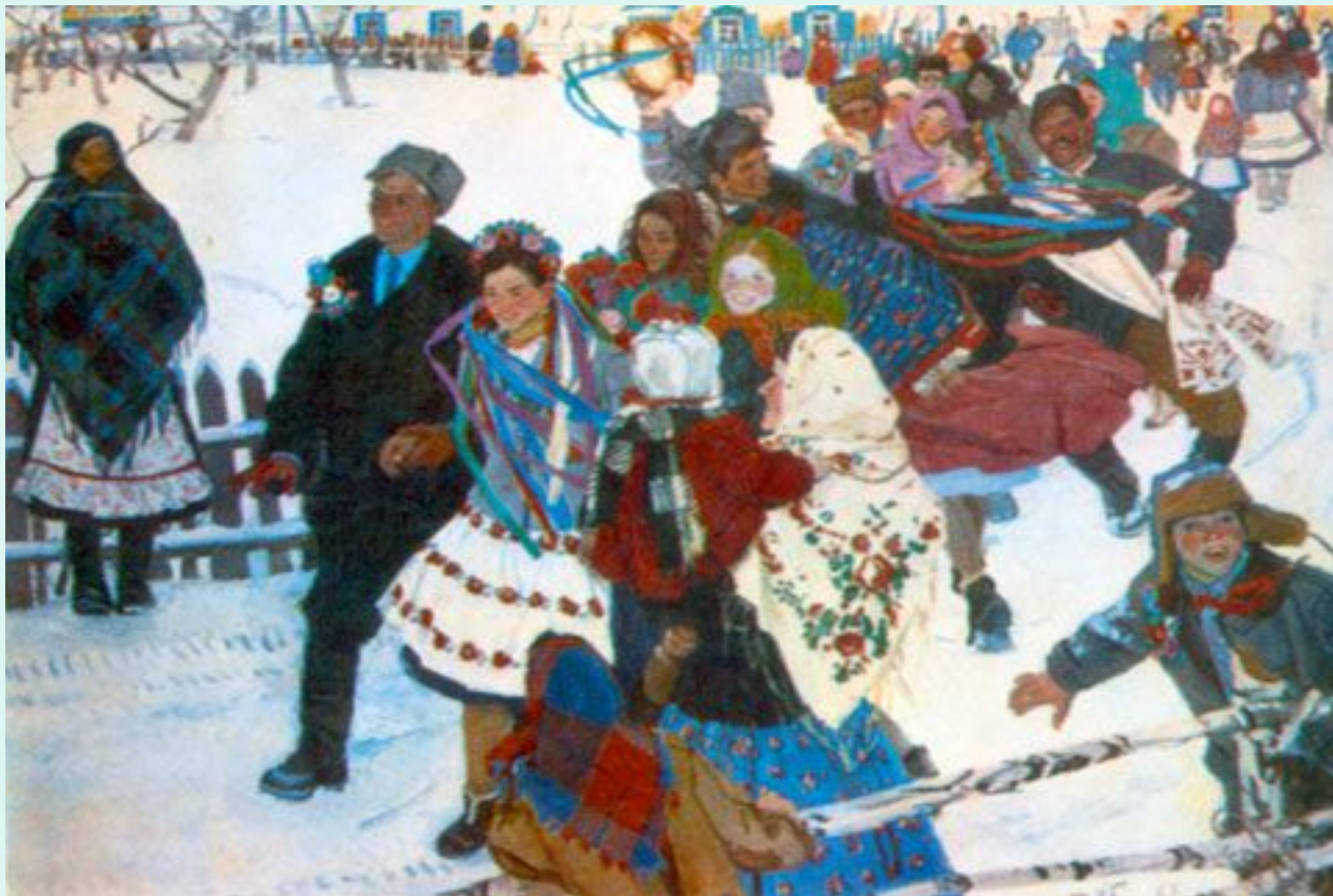
Татьяна Яблонская. «Свадьба», 1963 (оригинал)