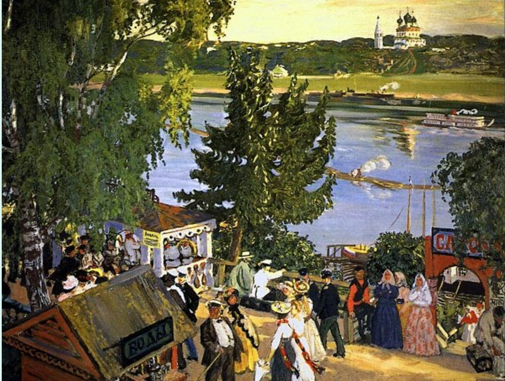
Борис Кустодиев. Прогулка на Волге. 1909 год. Изображена романовская сторона города Тутаева Ярославской области