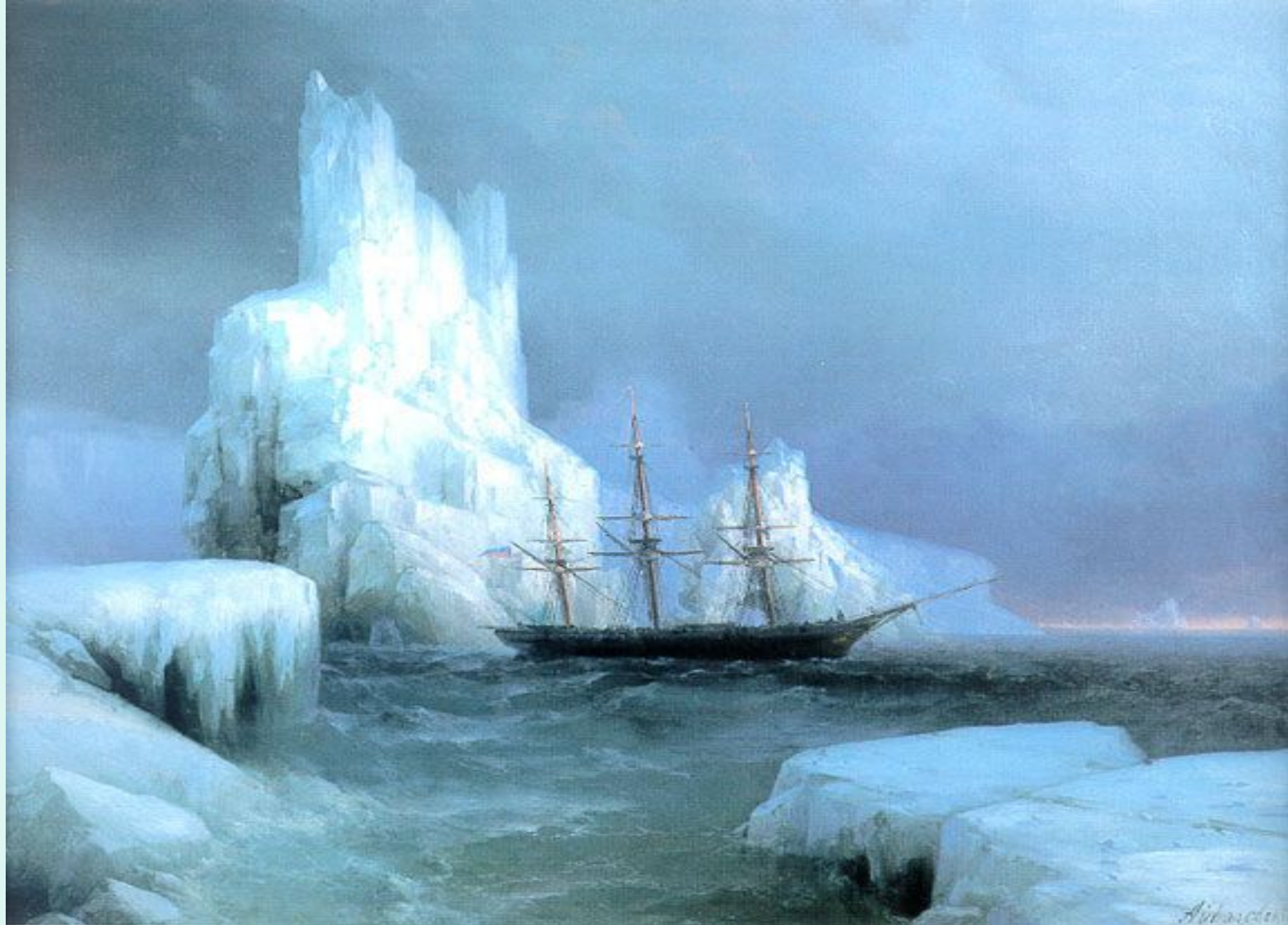
Ледяные горы 1870