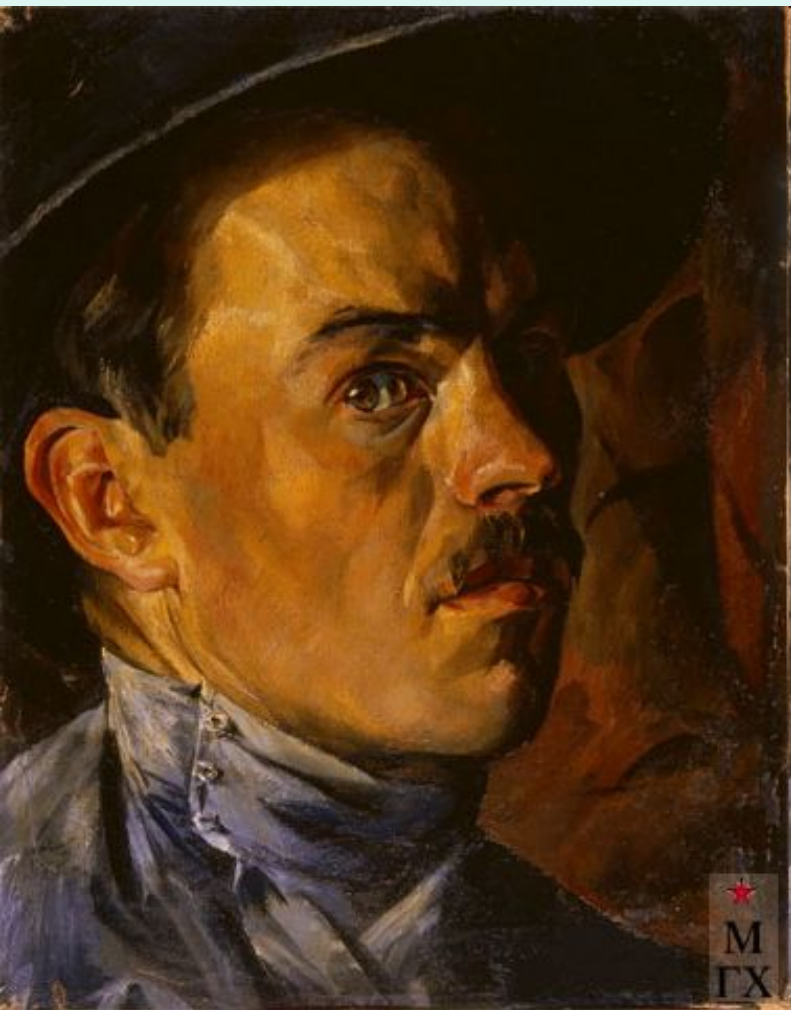
Автопортрет. Аркадий Александрович Пластов

Советский живописец. Заслуженный деятель искусств РСФСР, действительный член Академии художеств СССР (с 1947 ). С 1935 выступал с жанровыми картинами, отмеченными знанием быта советской деревни, любовью к её людям, жизненностью образов, живописным. Откликаясь на события, волнующие советский народ, Пластов изображал, как преломляются они в колхозной жизни; в качестве действующих лиц в картинах Пластова выступают обычно его односельчане.