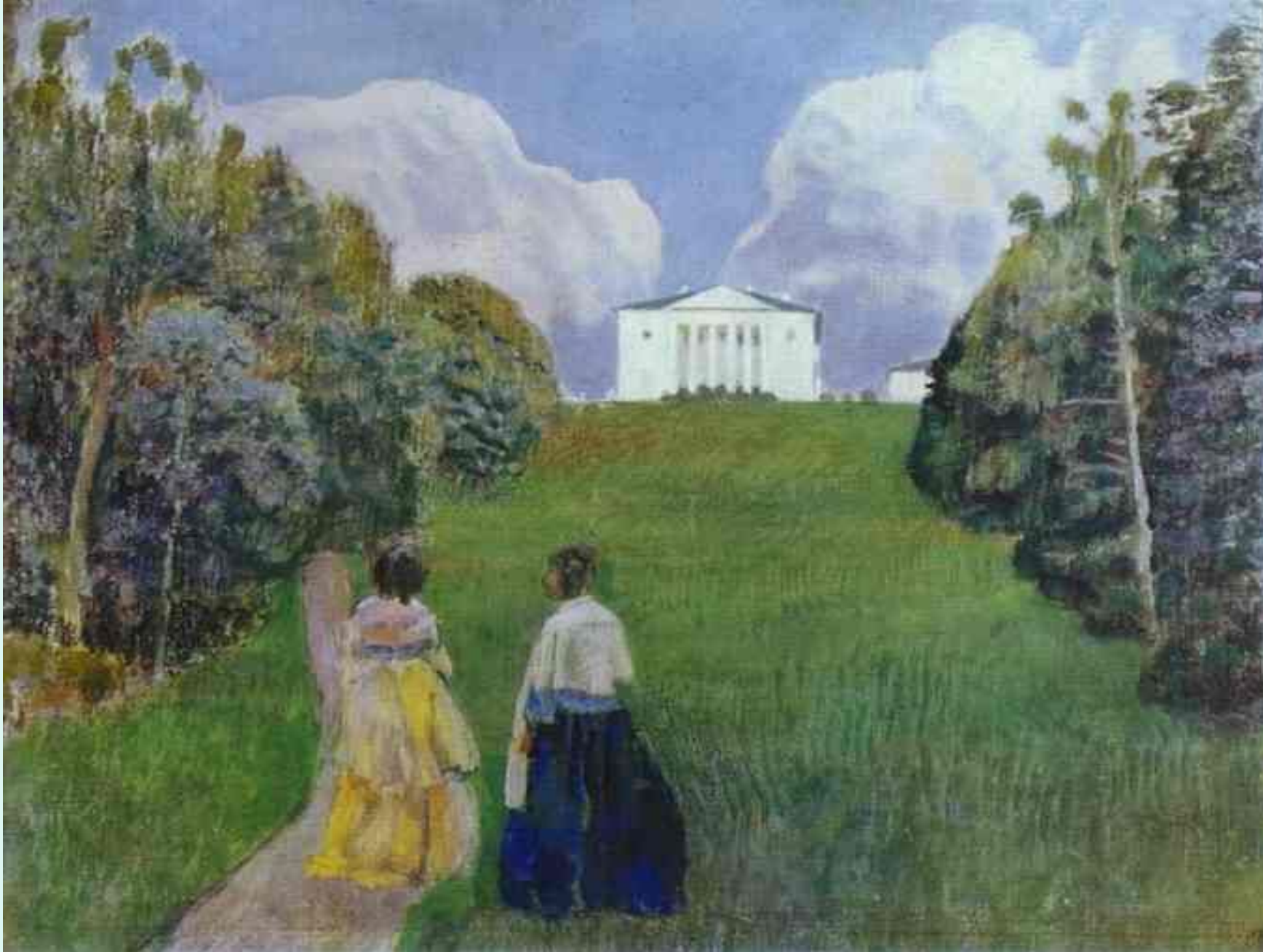
Галерея картин Галерея картин / 1904 — Весенняя история БОРИСОВ-МУСАТОВ