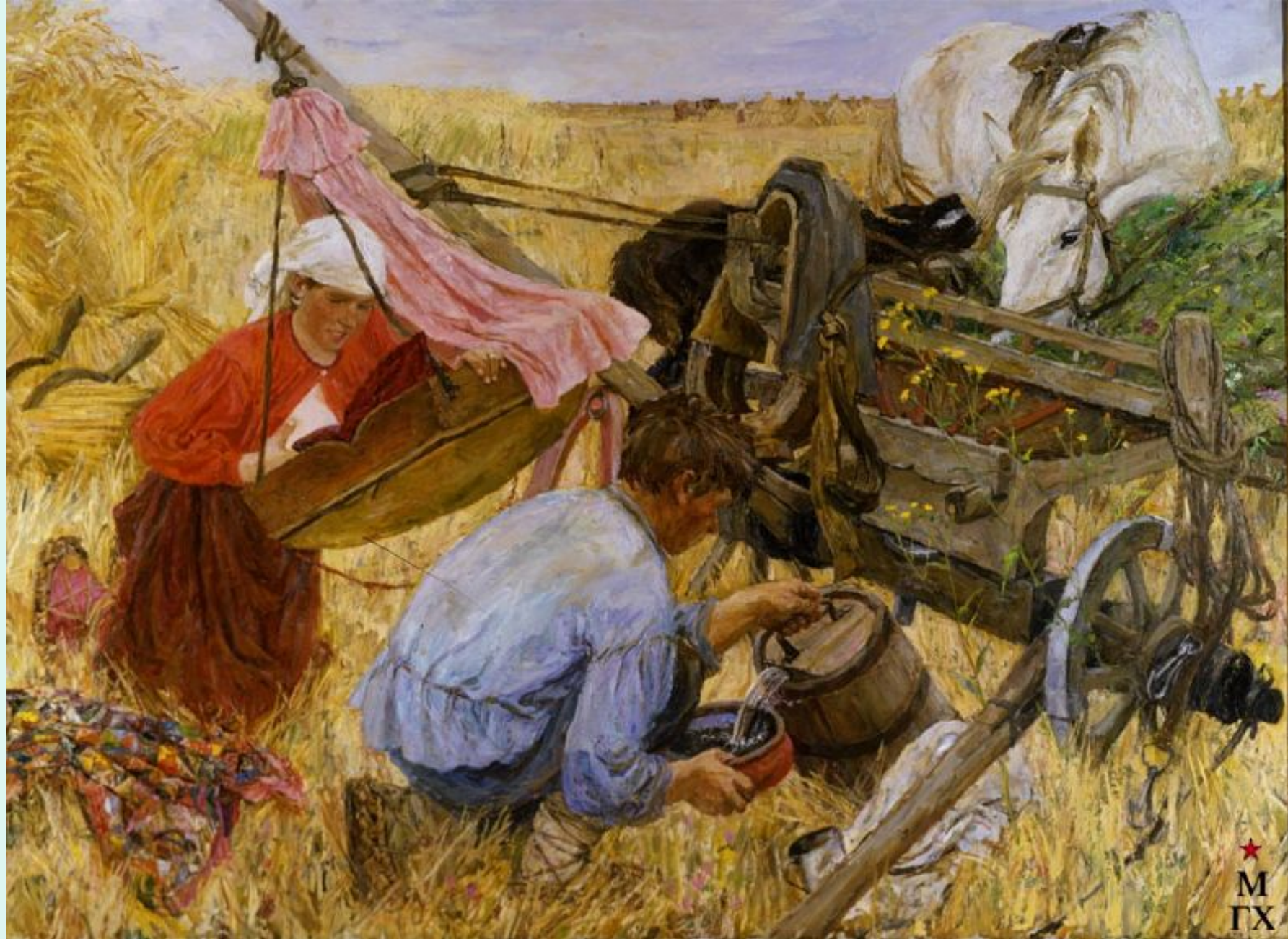
Из прошлого. 1969-1970. Пластов.