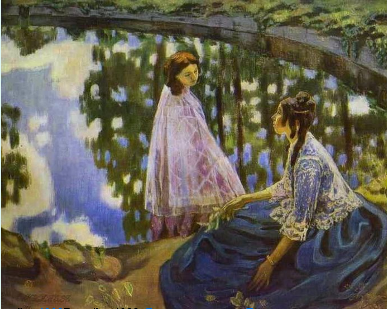
Водоём, 1902 Водоём, 1902, Государственная Третьяковская галерея Водоём, 1902, Государственная Третьяковская галерея, Москва Борисов- Мусатов