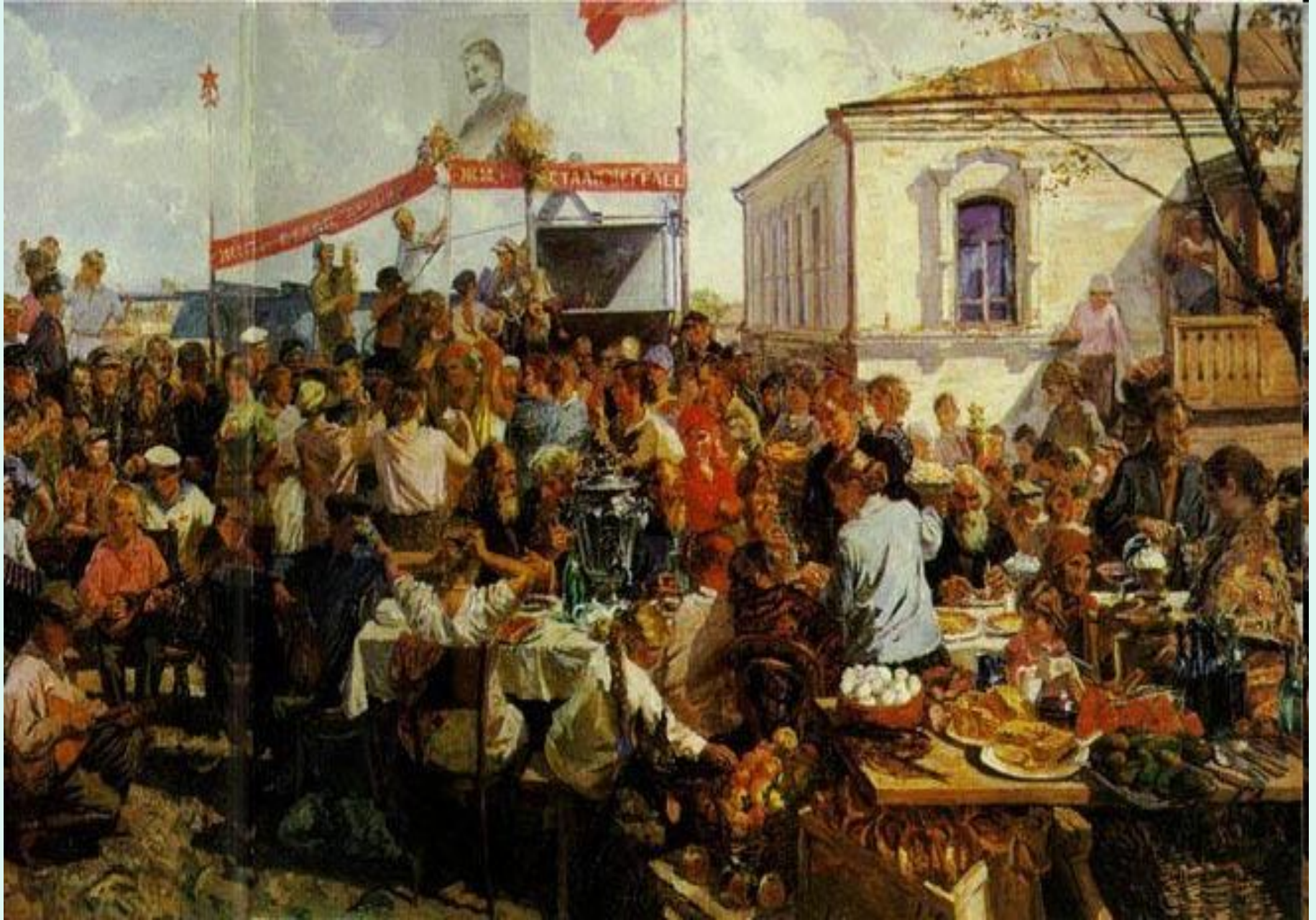
Колхозный праздник (Праздник урожая). 1937г.Пластов.