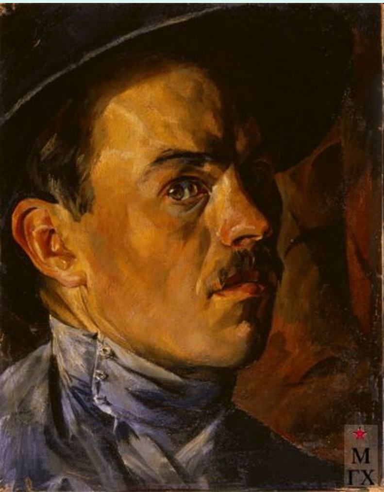
Автопортрет. Аркадий Александрович Пластов

Советский живописец. Заслуженный деятель искусств РСФСР, действительный член Академии художеств СССР (с 1947 ). С 1935 выступал с жанровыми картинами, отмеченными знанием быта советской деревни, любовью к её людям, жизненностью образов, живописным. Откликаясь на события, волнующие советский народ, Пластов изображал, как преломляются они в колхозной жизни; в качестве действующих лиц в картинах Пластова выступают обычно его односельчане.