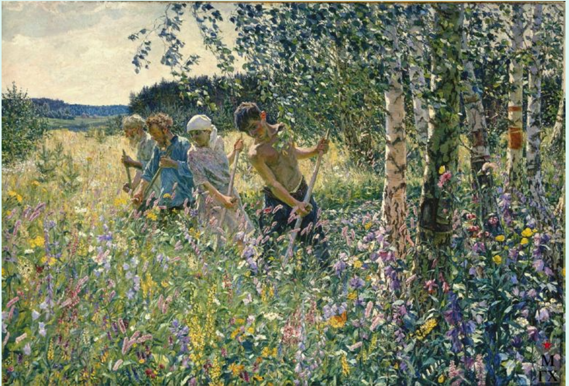
Сенокос. 1945г. Пластов.