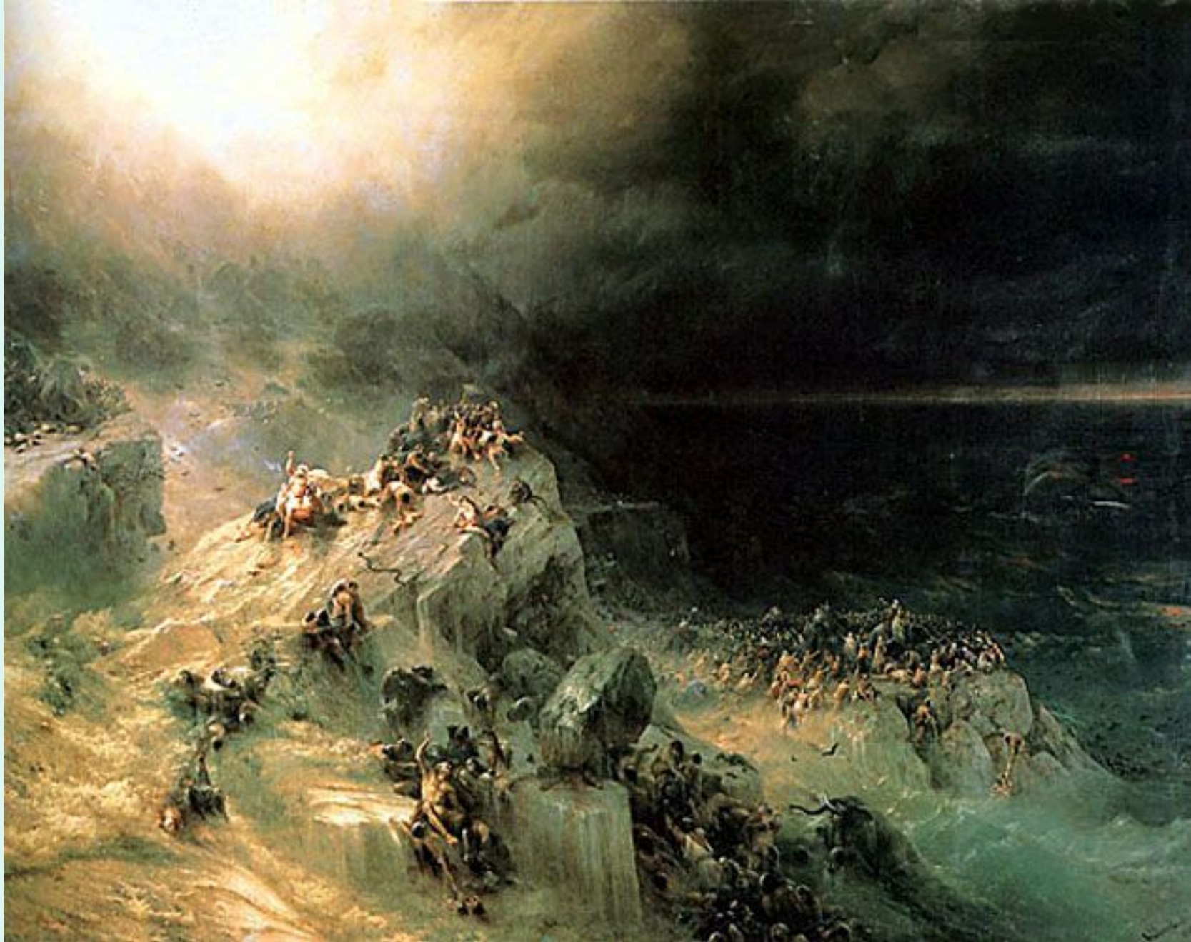
"Всемирный потоп" 1864 Айвазовский