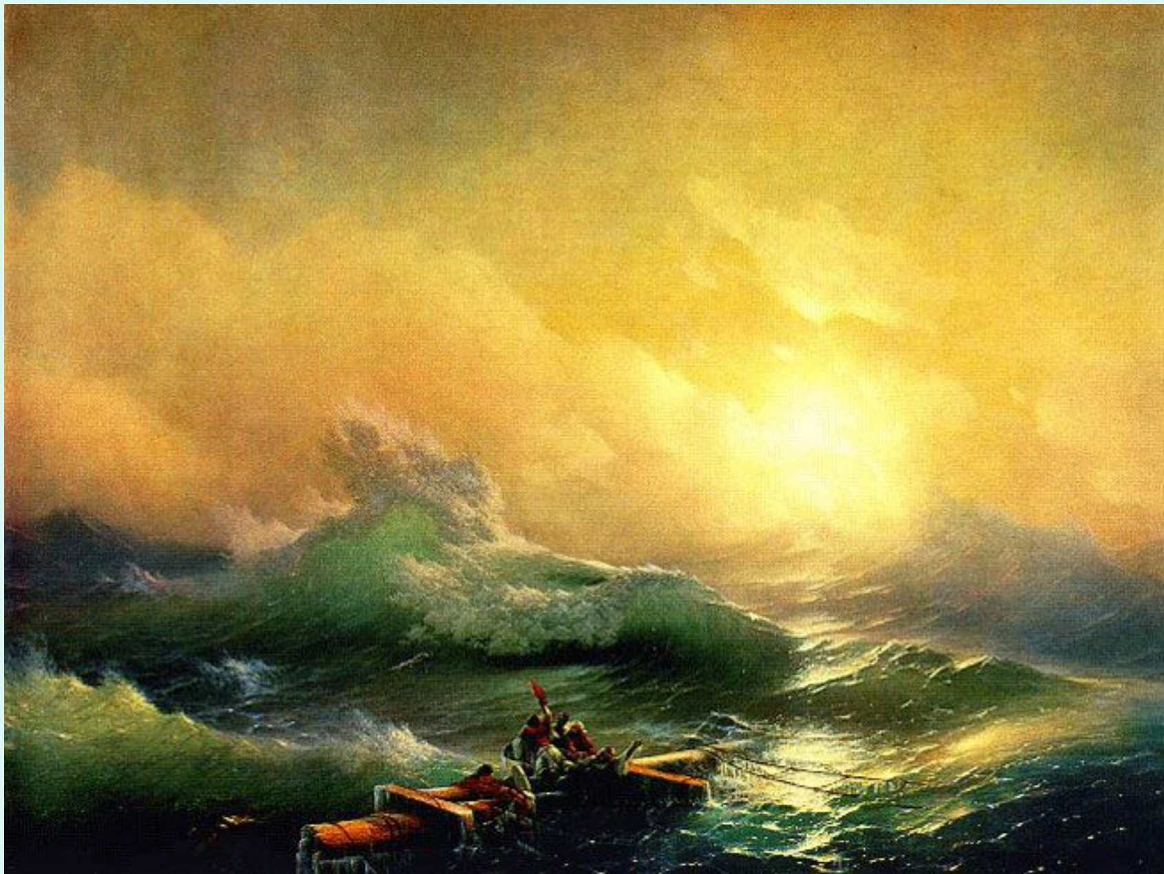
Девятый вал Айвазовский