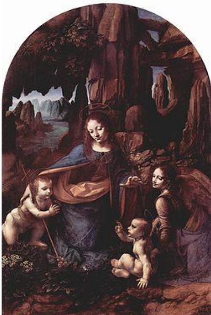
Мадонна в скалах