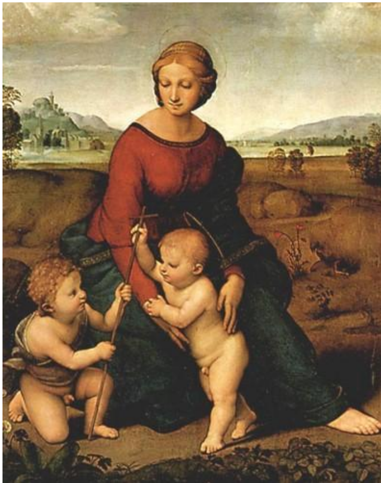
Мадонна в зелени