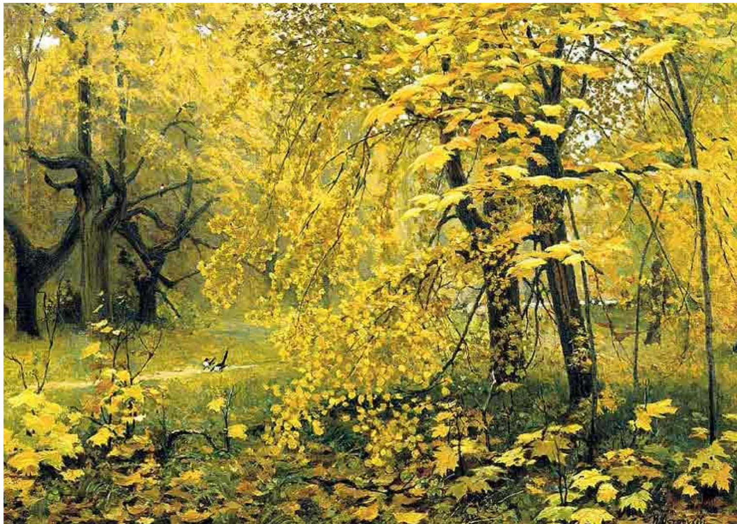
Остроухов Золотая осень