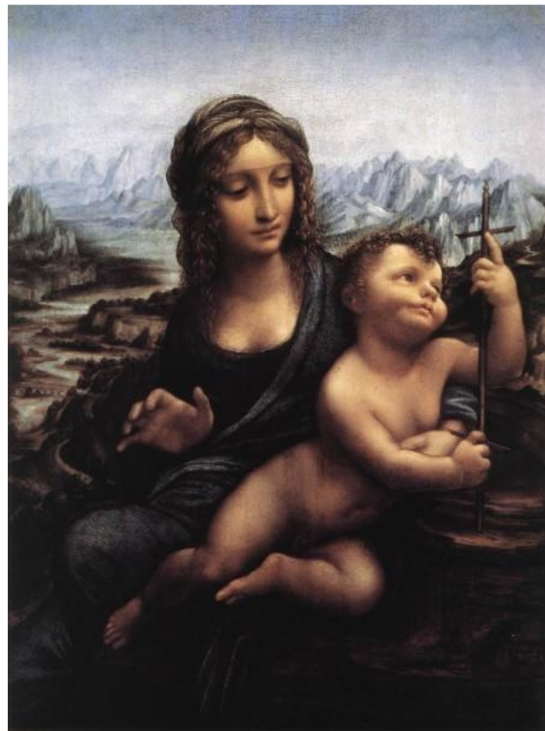
Мадонна с прялкой