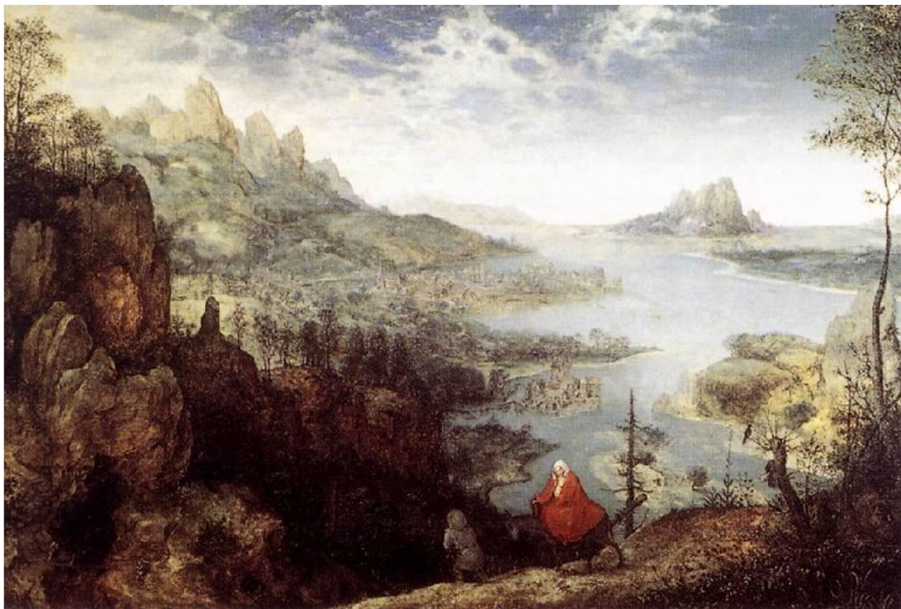
Питер Брейгель Старший Панорам а