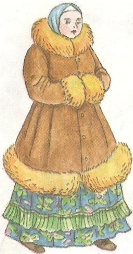
Мещанка в капоте