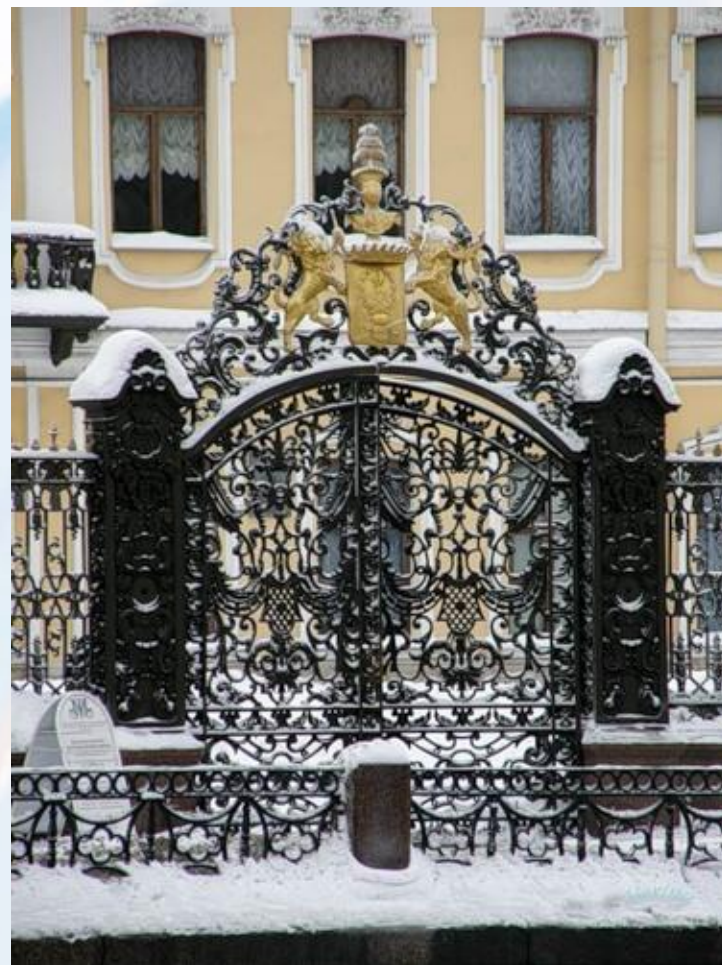
Городские решетки Санкт-Петербурга