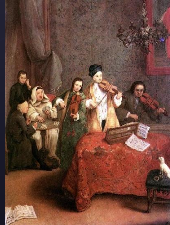
П. Лонги. Концерт.