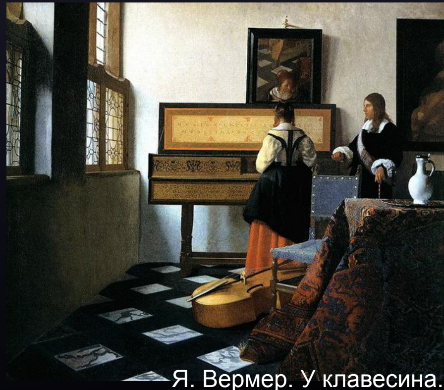
— Я. Вермер. У клавесина.