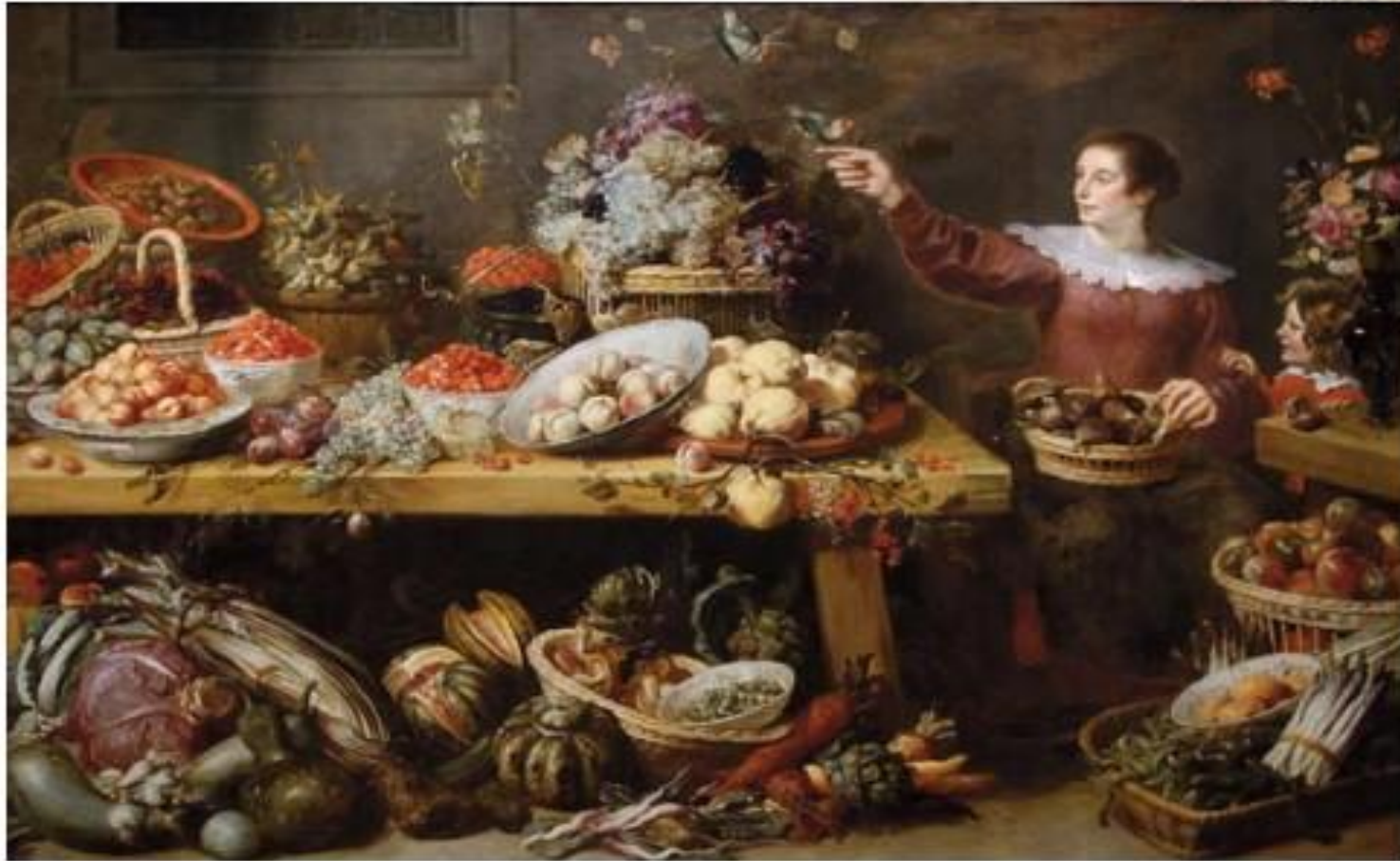
К. Снейдерс. Натюрморт с фруктами и овощами

Люди поразному воспринимали красоту и пользу окружающего мира.