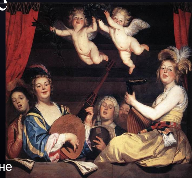
Г.Хонтхорст. Концерт на балконе