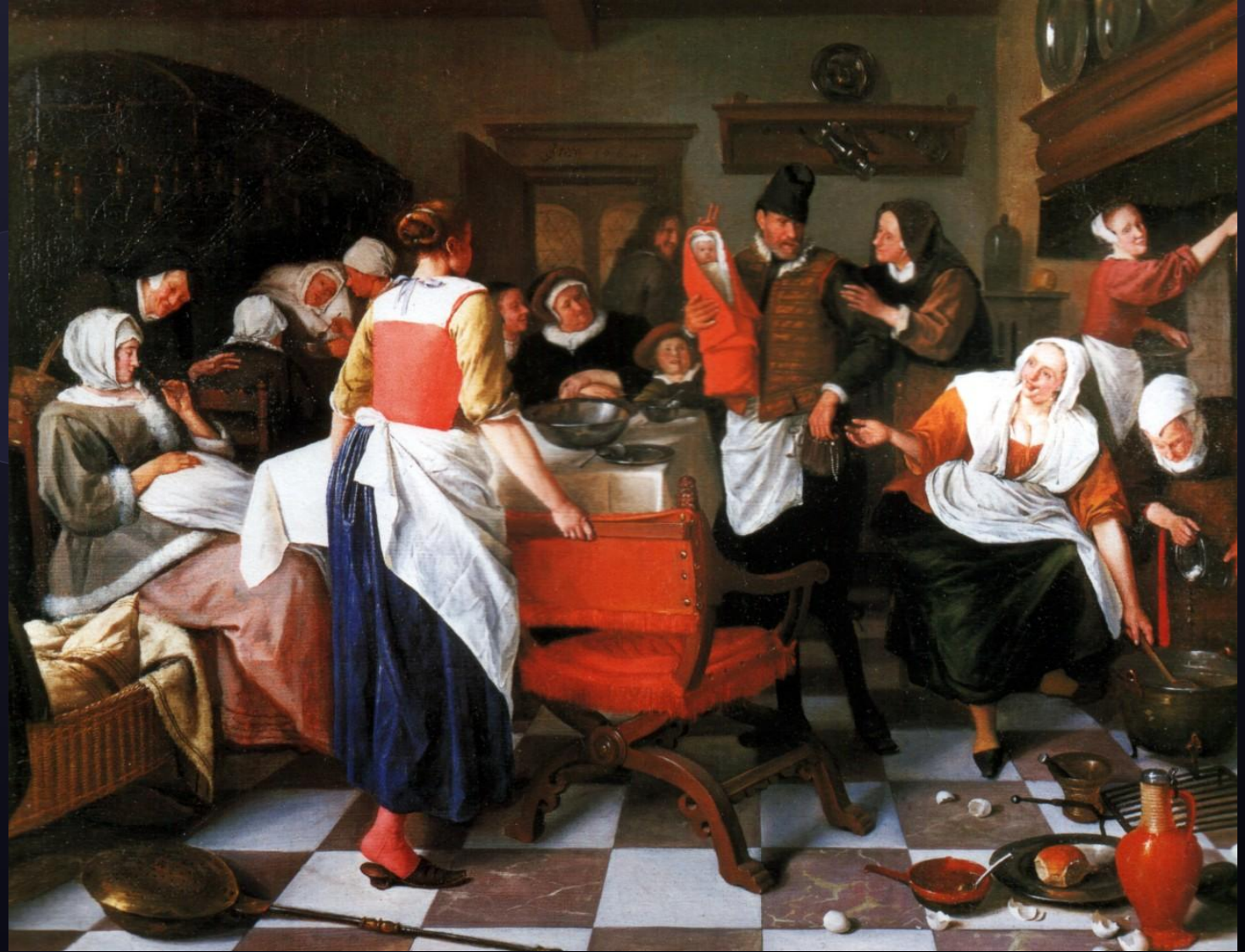
Ян Стен. Крестины.