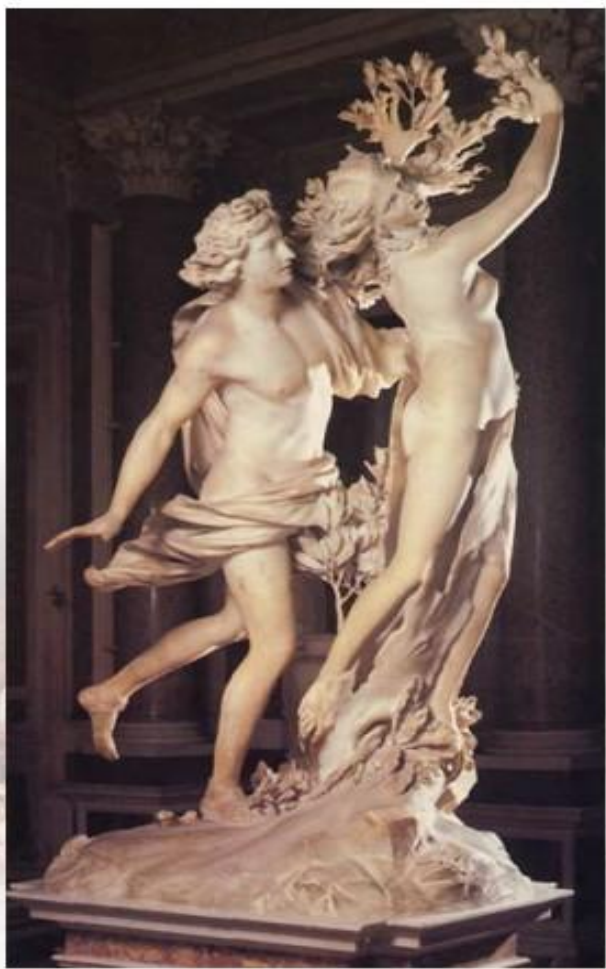
Дж. Бернини. Аполлон и Дафна