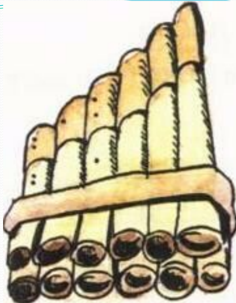
Флейта Древней Греции