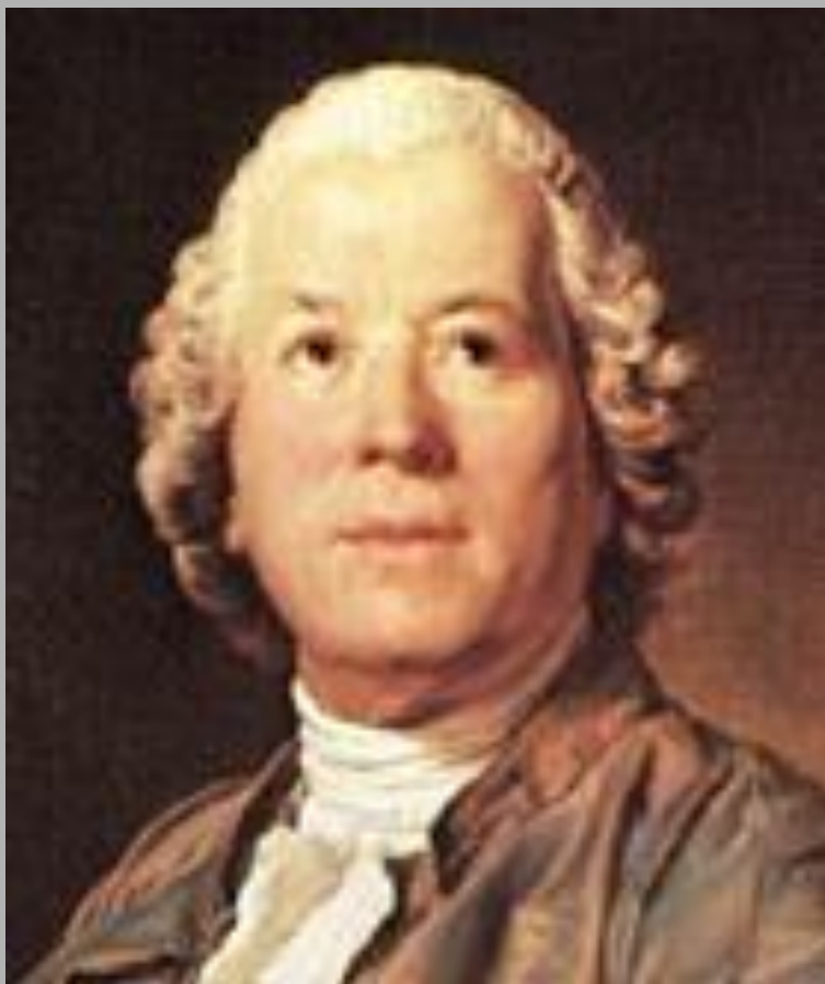
Кристоф Глюк (1714-1787)