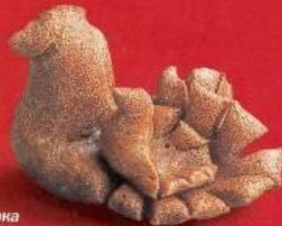
Тетёрка с птенцом