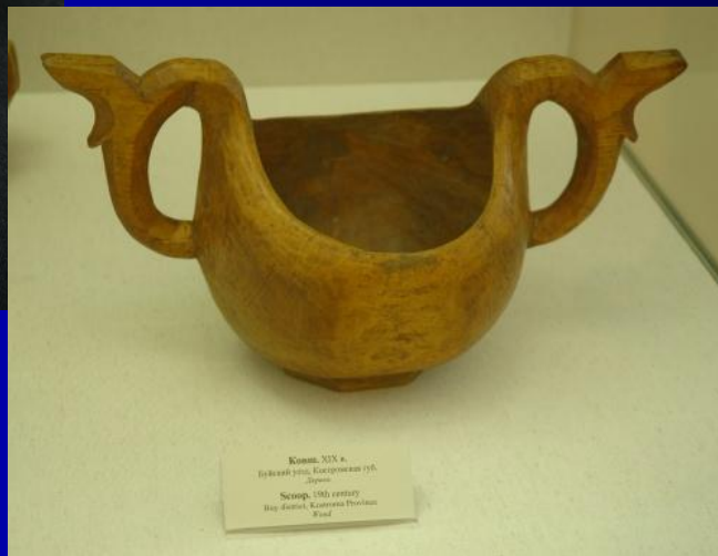
Кувалда XIX в. Булканий јазол, Костурински музеј, Скопје. Scopje, 19th century Bulky handle, Kosturina Museum Maced.