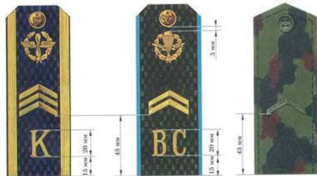
Сержант (для курсантов вузов, кроме ВМФ)

РАЗМЕЩЕНИЕ УГОЛЬНИКОВ, ЭМБЛЕМ, БУКВ, ЯКОРЕЙ НА ПОГОНАХ СЕРЖАНТОВ, СТАРШИН, СОЛДАТ, МАТРОСОВ И КУРСАНТОВ