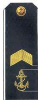
Главный старшина (для курсантов вузов, ВМФ)