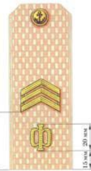
Старшина 1 статьи