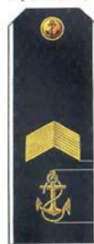
Главный старшина (для курсантов вузов, ВМФ)