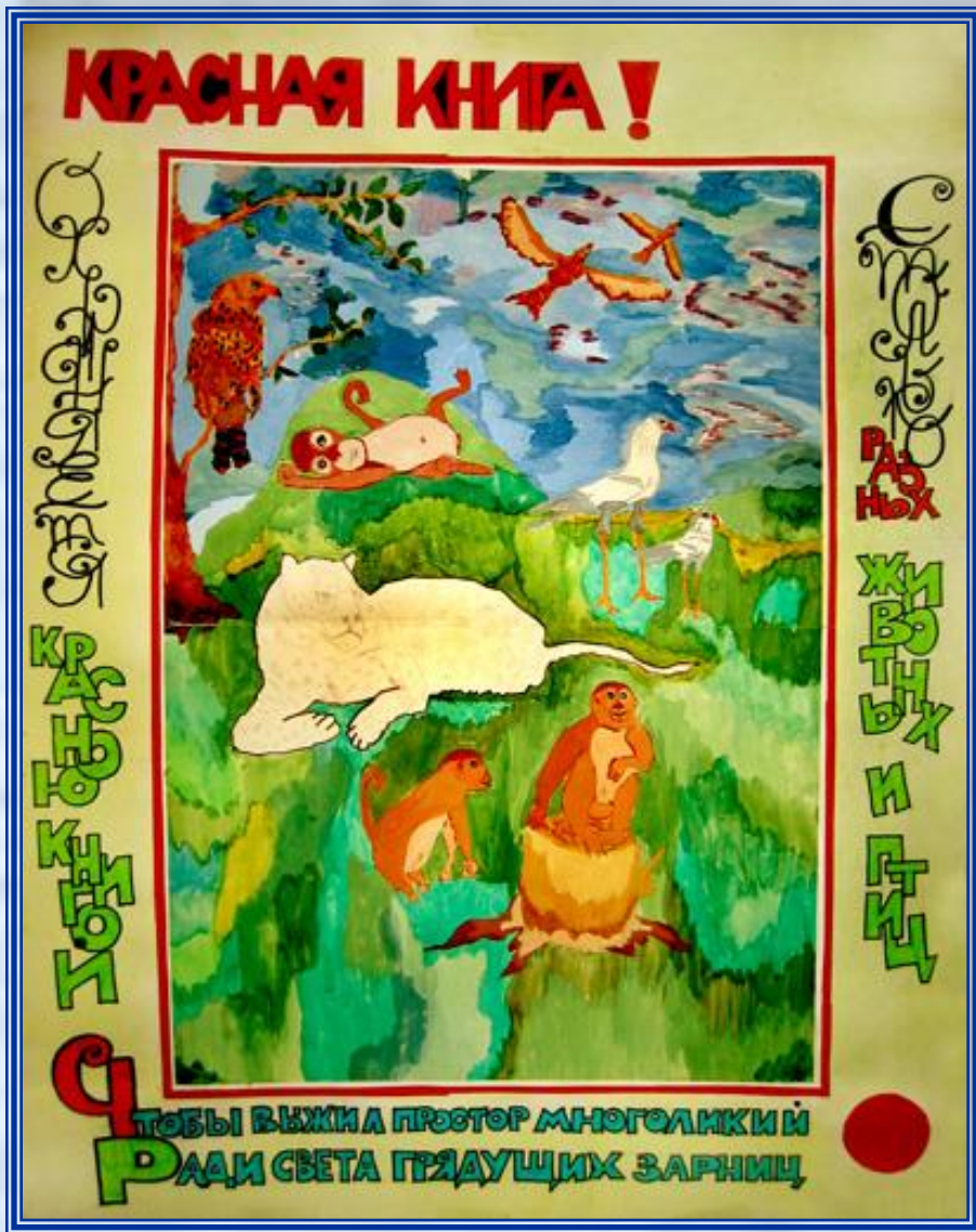
плакат «Красная книга»