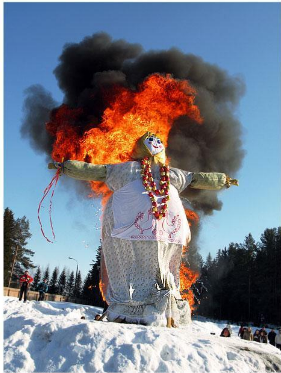
Масленица. Киров, Россия. 2008